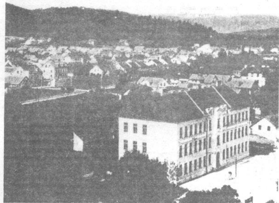
Osnovna šola Vič z bližnjo okolico v letu 1922

Sprva velja poseči celo v prejšnje stoletje, ko so naprednejši Vičani pošiljali svoje otroke v ljubljanske šole. Da bi zgradili svojo, so začeli razmišljati okrog leta 1870. Dobili so jo leta 1896, ko je ljubljanska občina onemogočila šolanje viških otrok v mestnih šolah. Sprva se je pouk odvijal v zasebnih hišah, 1898 so zgradili prvo šolo ob Tržaški cesti, ki pa je bila kmalu premajhna. Veliko, novo prostorno šolo so zgradili leta 1911 in ta šola še danes služi svojemu namenu. Poznamo jo vsi, saj stoji ob »gimnazijski« stavbi na Tržaški cesti. Že ob otvoritvi je bila šestrazrednica in pouk v njej je obiskovalo 600 otrok, dve leti kasneje pa se je številka povzpela na 844. Kot zanimivost velja omeniti, da je bil tedanji šolski upravitelj oproščen pouka, kar je bil prvi primer na Kranjskem. Med prvo svetovno vojno je bil pouk spričo zasedbe vojske močno skrčen in oviran. Šola se je razširila v osemrazrednico leta 1919, ko je bil uveden tudi obvezen pouk telovadbe za deklice. Pričela se je tudi obrtna nadaljevalna šola ter pomožni oddelek za slabše nadar-