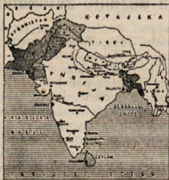
Indija in Pakistan

jo morajo še dodatno uvažati. V Vzhodnem Pakistanu pa, kjer je vlažna Bengalija, goje v glavnem riž, ki zavzema 75%