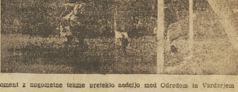
Moment z nogometne tekme preteklo nedeljo med Odredom in Vardarjem