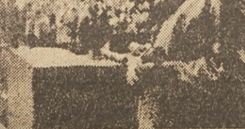
Prizori z letošnje Titove štafete: na levi sestop alpinistov z Velikega Triglava, na desni pa predsednik vlade LRS tovariš Miha Marinko med govornom

Predsednik: Josip Vidmar Sekretar: Miha Marinko