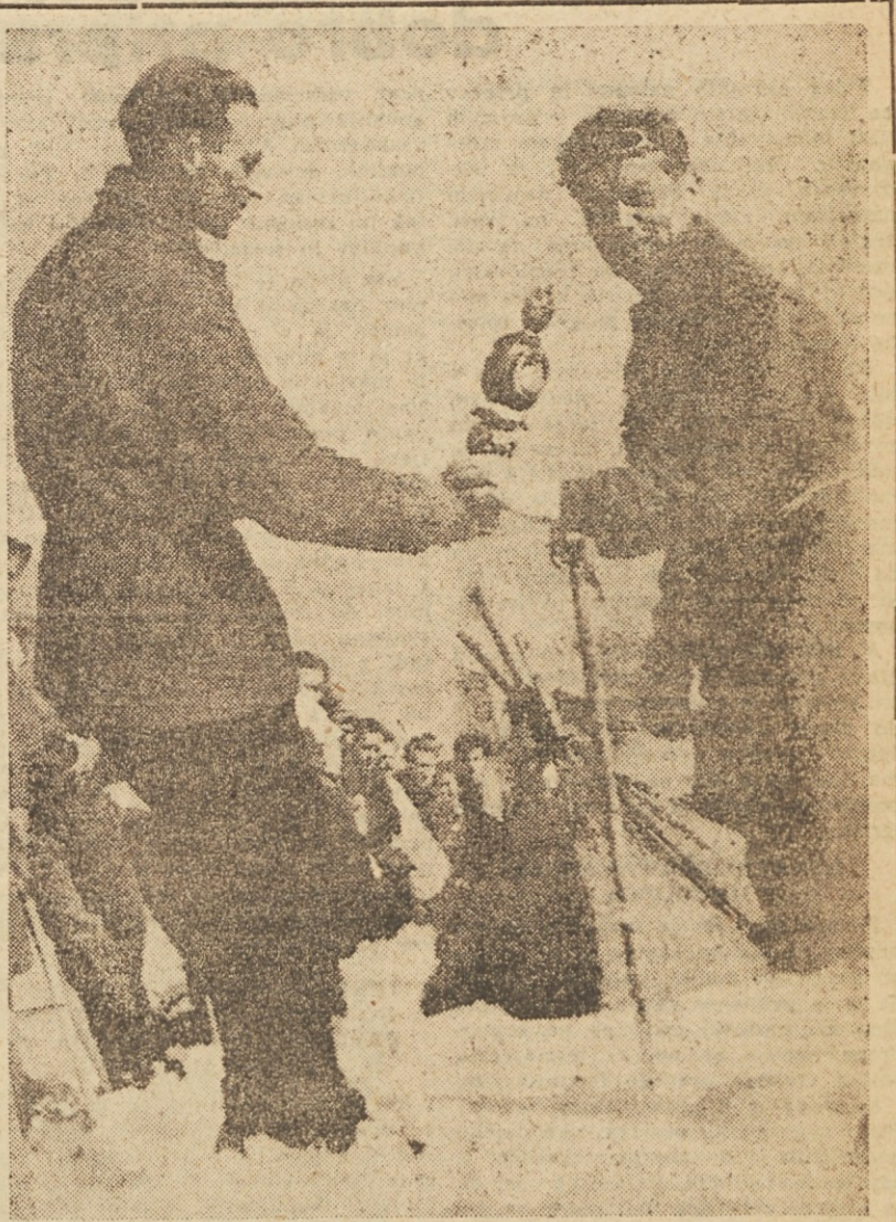
Na vrhu Triglava. Tov. inž. Deržaj pravkar predaja štafeto palico prve-mu tekaču, znanemu alpinistu Joži Čopu