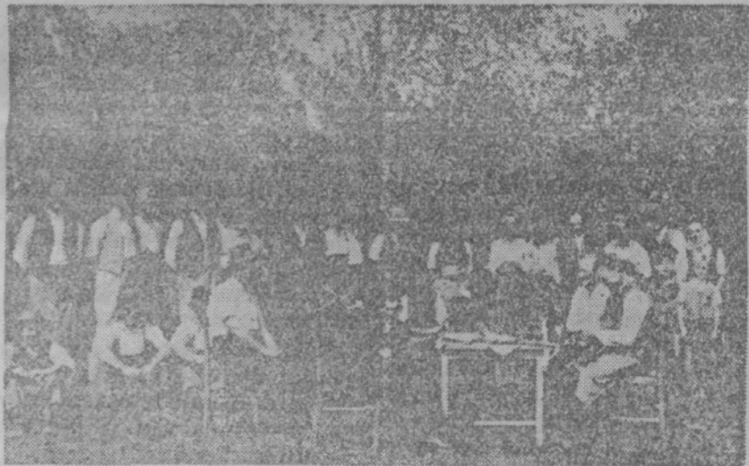
Zbori volivcev so se vršili tudi na prostem

zijo bo gotovo znalo najti izhod iz te situacije. Upamo, da bosta mladinska in pionirska organizacija, katerih glavna naloga na šolah je izboljšanje učnega uspeha, storili svojo nalogo. Sklepi nedavne mladinske konference na gimnaziji se od prve redovalne konference niso izvajali. Dijaki ptujske gimnazije stoji sedaj pred dejstvom, da dokažejo, da se zavedajo svoje naloge in da doprinesejo svoj delež k izgradnji socializma s tem, da bodo izpolnjevali besede tovariša Tita: »Učiti se, učiti in zopet učiti!«