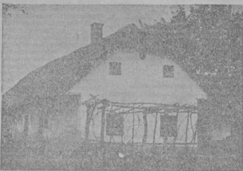
Lacovna domačija — prednja in zadnja stran

Gospodarski položaj je oblikoval reakcionarno zavest posejancev, na drugi strani pa so oblikovale slabe življenjske prilike napredno zavest delovnega ljudstva, zato je moralo priti do nove družbene ureditve v naši državi, v kateri bo gospodarski napredek oblikovala le zavest vsega delovnega ljudstva v novi Jugoslaviji. P. S.