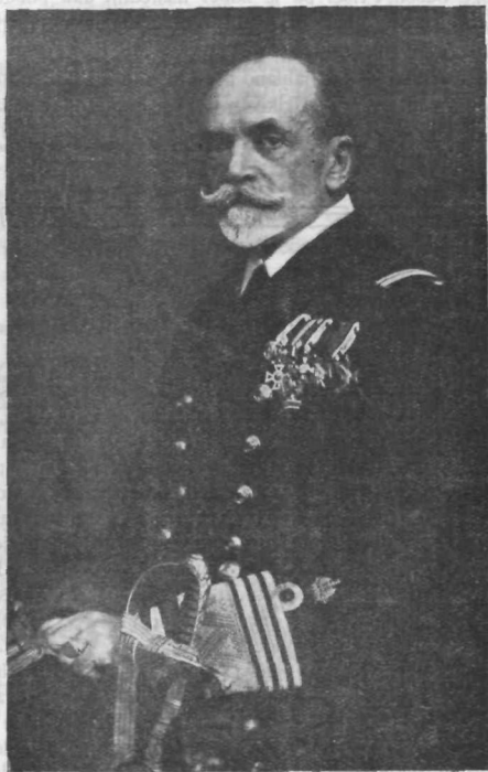
Veliki admiral Anton Haus