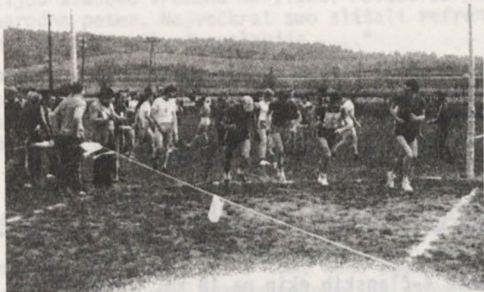
Motiv iz lanskoletnega pohoda

Prva slovenska brigada - II. grupe odredov, ki se je rodila na naših dolenjskih tleh spomladi 1942, je mnogo pripomogla k širjenju svobodnega ozemlja na Dolenjskem in izbojevala na našem območju nekaj zmagovitih bitk. Srce vseh teh bojev pa pomeni "Muljavska bitka", kakor imenujemo večdnevne boje od 6. - 12. junija 1942, ki so se odvijali v dolini Krke - v okolici Muljave.