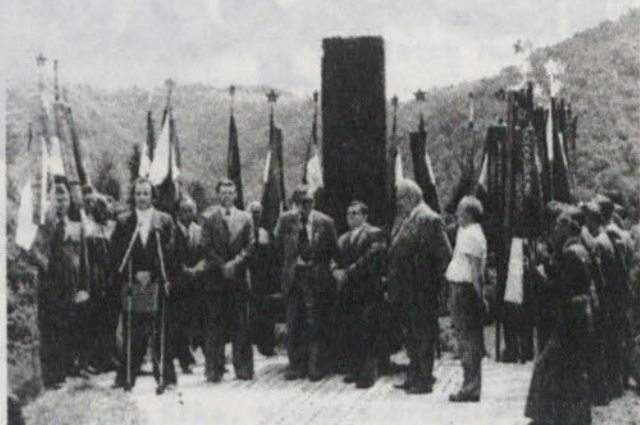
Ob odkritju spomenika na Debečem