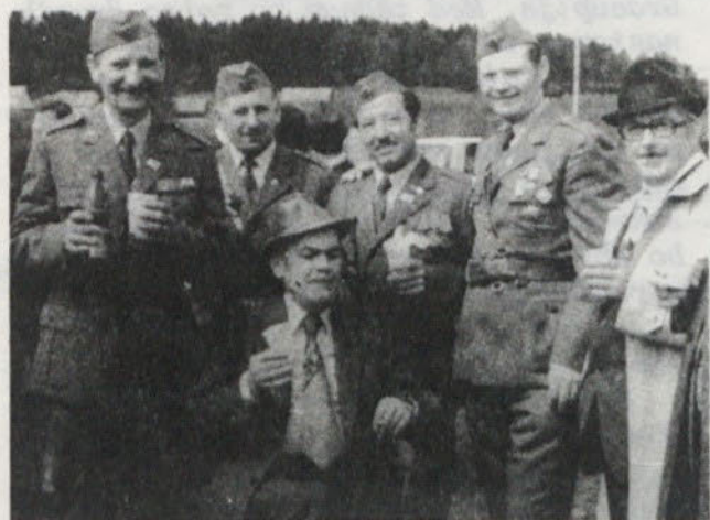
STANTE med soborci