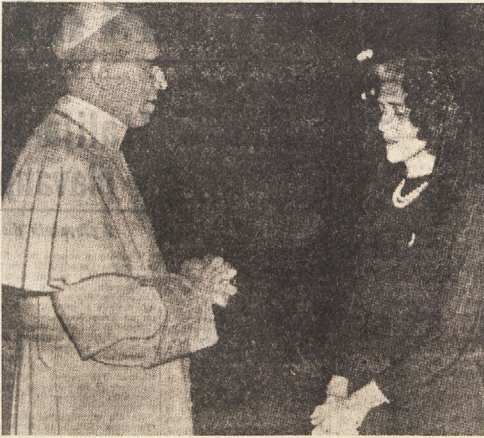
Bivši ameriški veleposlanik v Rimu ga. Clara Both Luce je na svojem obisku v Italiji zaprosila tudi za sprejem pri papežu. Njena spokorniska družina je morda le v zvezi z njeno dosedanjjo dejavnostjo ali ima za bregom nekaj novega?

A sedaj opažamo, kako se je med našimi starši in tudi njihovimi otroci ohladilo nekdanje navdušenje za to šolo in žal mnogi — če dovolite izraz aneviden — izgubljajo zaupanje in v koristi diplome učiteljske.