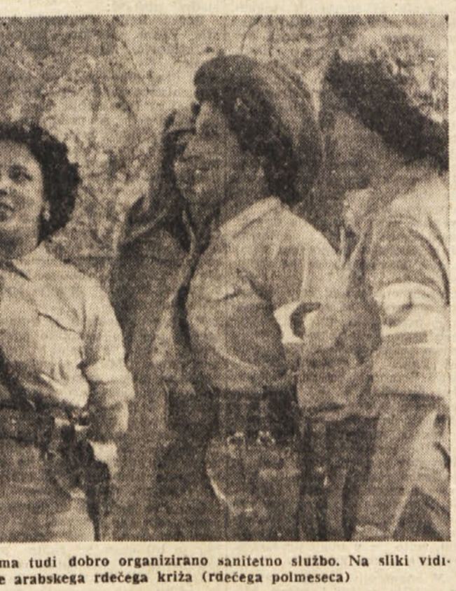
Alžirska osvobodilna vojska ima tudi dobro organizirano sanitetno službo. Na sliki vidimo tri bolničarke arabskega rdečega križa (rdečega polmeseča)

šeposebne straže. Toda konferenca ni bila v podzemskem bunkerju, kot je bilo prej dočleno, ampak v Gaestebrau, ki je v veliki leseni baraki v bližini. V baraki je bila v sredini velikanska miza, ki so jo prekrivali zemljevidi. V baraki je Stauffenberg vstopil skupno s Keitlom. Vsi razen stenografov so stali. Glavno poročilo o vojaškem položaju je imel general Heussinger. Hitler je neprestano zijal v zemljevide na mizi. Stauffenberg je zavel svoj prostor, tako nato položil svojo aktovko na svoje mesto (Wheeler-Bennet ne pove, če ta lista ali na stolcu) in v svojem sedlu polkovnika Brandta šepnil: »Pasčam to tu za trenutek, moram nekam telefonirati. Ker je Brandta verjetno aktovka motila, jo je z nožo potisnil pod mizo in ta na nasprotno stran od tiste, kjer je stal Hitler. Ta malenkost je bila vzrok, da atentat ni uspel.