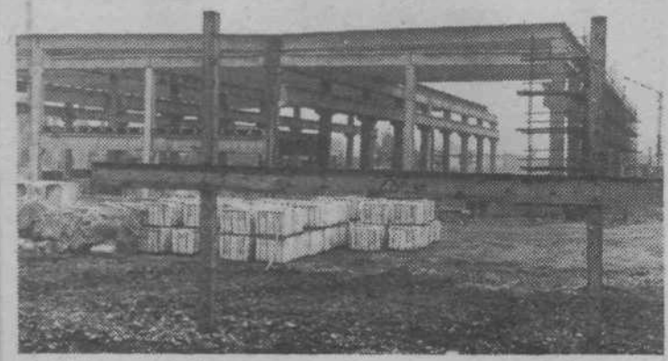
Gradbišče nove Gradisove tovarne gradbene opreme in strojev v industrijski coni MP — 3