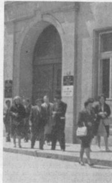
Odborniki OLO enkrat drugače: Vrh Narodnim domom po zaključeni seji