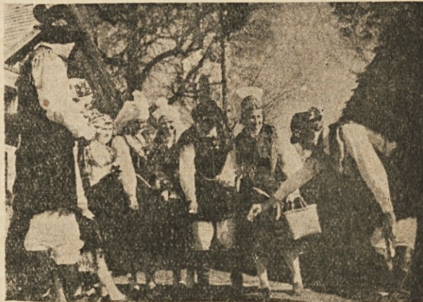
Begunci na Koroškem v slov. narodnih nošah

Esta poderosa corriente de las actitudes —dice Eucken— puede arrastrar consigo también la persuasión; y a la humanidad le parece, que "despuntó un nuevo día, en comparación con la luz del cual todo lo que era, no es más que el muerto pasado". Se entiende que este poseído de sí mismo no puede durar largo rato. Si el hombre dirige sus pensamientos a sí mismo se le levanta en el alma misma la resistencia contra el naturalismo. El hombre llega a sentir en su interior algo más que el mecanismo inánime. Con ello mismo, ya que domina sobre la naturaleza, testifica que está sobre la naturaleza. Esta falta del naturalismo, algo rato lo completa con las cantidades y bienes que había rechazado. Tiene "la concepción del mundo" aunque la concepción del mundo como la uniforme mirada sobre todo, se extiende sobre la limitada sensualidad. El se sirve de las "ideas