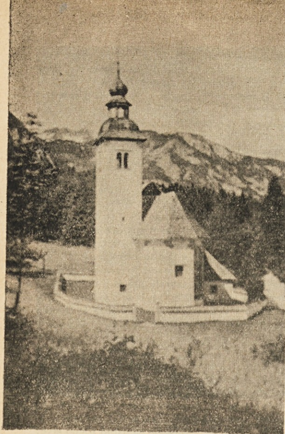
Bohinj — Sveti Duh