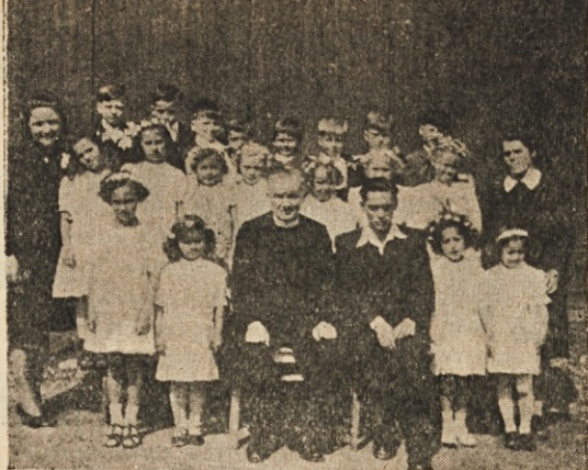
Prvoobhajanci v taborišču.

O odločilnem pomenu družinske vzgoje nam govore dovolj jasno tudi nasledki zanemarjene ali slabe družinske vzgoje. Življenje mladih ljudi samo nam namreč dan na dan dokazuje, da so otroci skoraj po neki notranji nujnosti dobri, če so bili v družini deležni dobre vzgoje; uči nas pa tudi nasprotno, da so otroci, ki so v družini prejeli le površno ali napačno vzgojo, večinoma igrače neurejenih nagnjenj, nesrečni v sebi, bole-