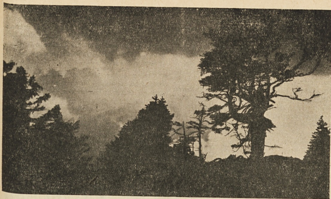
Iz naše lepe domovine: Poslednji žarki v gorah.

vajo. Padlo je na desetisoče mučencev; koliko natančno, ve samo Bog.