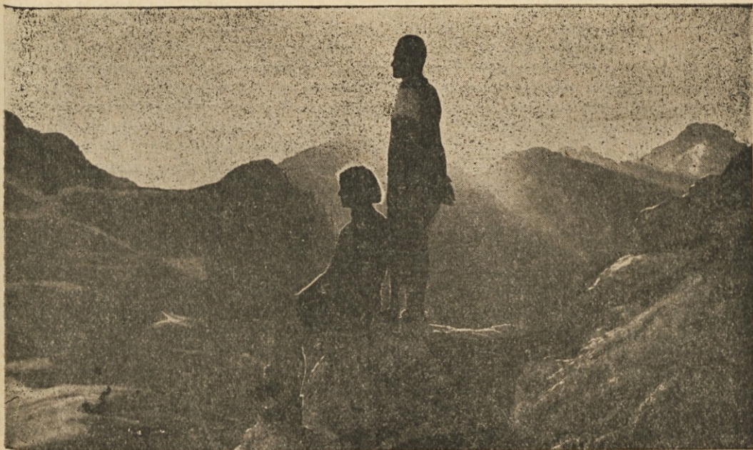
Večer na Kredarici. — Večne pomladi vabi nas žar...

svobode in sreče. Za varstvo teh pravic se med ljudmi snujejo vlade, katerih oblast poteka iz pristanka vladanih. Ljudstvo ima pravico spremeniti ali odstraniti obliko vladavine, ki ne ustreza več tem ciljem ali jih ovira."