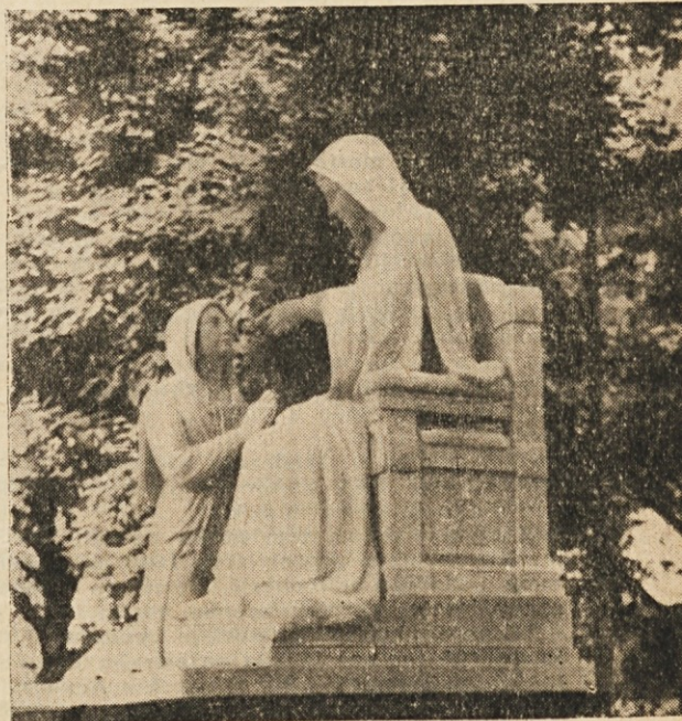
Kip Brezmadežne s sv. Katarino Laburé pred cerkvijo čudodelne svetinje