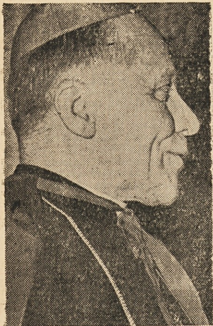
Praški nadškof msgr. dr. Beran

niso pustili oddati pisem na pošto, češ da nimajo dovoljenja od ministrstva, nadškofa dr. Berana so prisilili, da je spremljal policijo, ki je naredila preiskavo v nadškofijskem dvorcu. 7. Nadškofu v Pragi je vlada sporočila, da ga bo oddelk policije spremljal na vseh potih, "da ne bo ogrožena njegova osebna varnost".