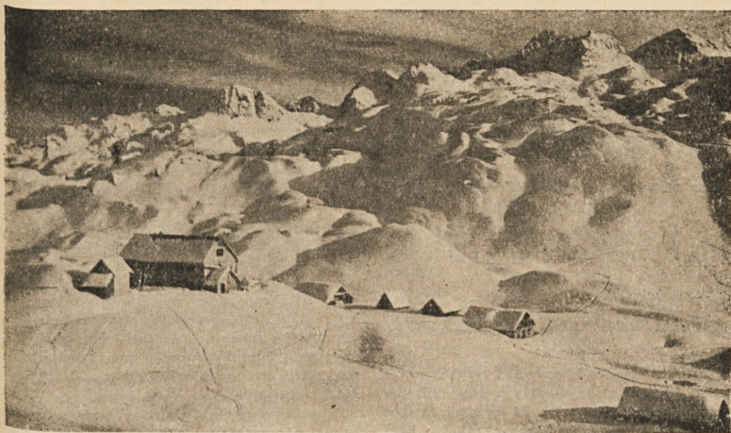
Koča pod Bogatinom. — Na planine, na planine vedno vleče me srce...

bodo dočakali! Zakaj ne? Zato, ker je komunizem protinaraven . — Krščanstvo mnogo zahteva od človeka, ko zapoveduje, da ljubimo svojega bližnjega tako kakor sami sebe. Ravno zaradi te zapovedi je krščanska vera za mnoge pretežka. Toda komunizem v svoji osnovi zahteva neizmerno več: ljubiti bližnjega bolj kot samega sebe! Kako bi mogel komunizem s sredstvi, s katerimi razpolaga, z materializmom, ki ga uči, tako globoko preobraziti človeško naravo?! Nikoli! Ljudje krive hrbte pod nasiljem. Čim bo vsled notranjih ali zunanjih vzrokov komunistom padel bič z roke, bo tudi že konec njihovega "socializiranega" človeka!