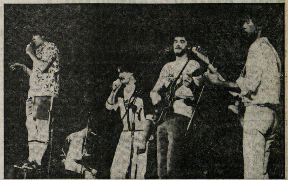
V petek zvečer je v Boljuncu nastopila kabaretna skupina s srečanjem «Vse manj je dobrih osem»