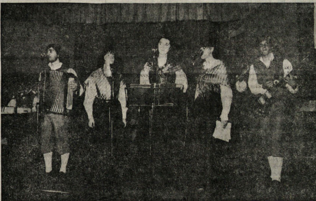
V Finžgarjevem domu na Opčinah je v nedeljo nastopil ansambel Galebi