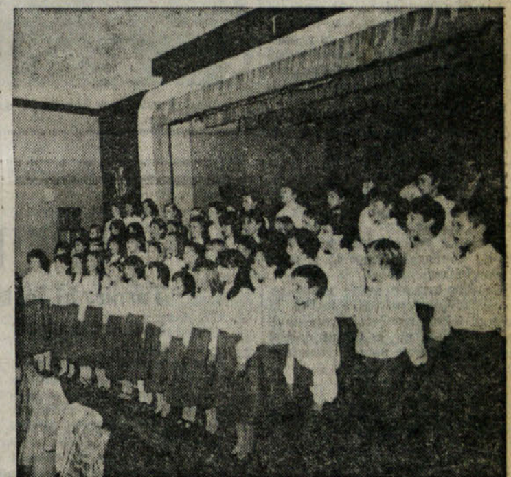
V Finžgarjevem domu je nastopil tudi otroški pevski zbor Vesela pomlad