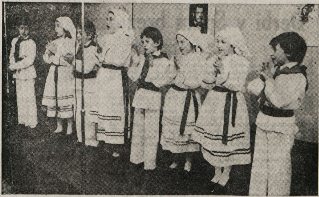
V dvorani KD Ivan Grbec v Šklednju je na sobotnem večeru škedenjskih Slovencev nastopila tudi folklorna skupina najmlajših