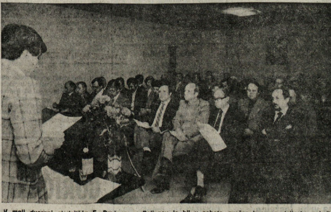
V mali dvorani gledališča F. Prešeren v Boljuncu je bil v soboto zvečer kongres dolinške sekcije Slovenske skupnosti