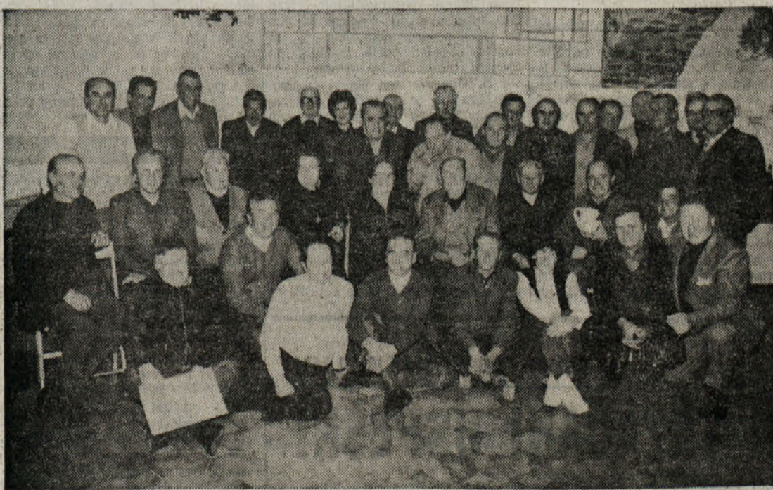
Skupina vinogradnikov, ki so razstavljal letošnja vina na razstavi v Babni hiši v Ricmanjih