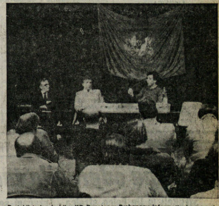
Pretekli teden je bil v KD Rapotec v Prebenu informativni sestanek med gasilskim društvom Breg in vodstvom tržaških gasilcev