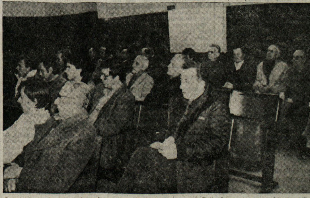
Pretekli teden je bilo v dvorani gledališča F. Prešeren sestanek Boljunčanov, ki ga je sklicala dolinška občina