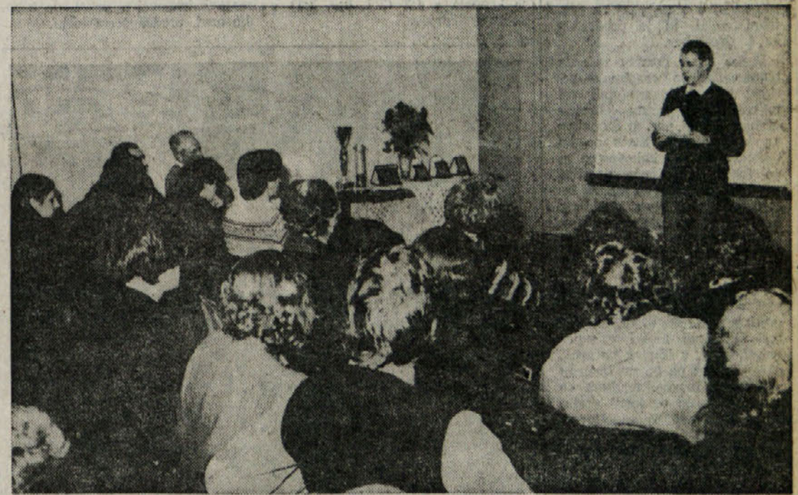
V soboto zvečer je bila v Gregorčičevi dvorani nagraditev prvega natečaja «Foto Trst 80»