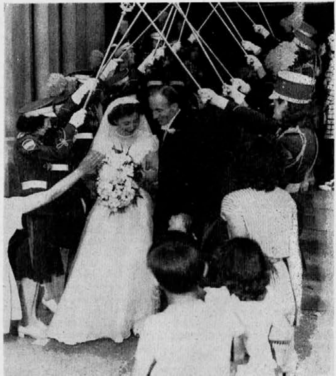
Bridge of Honor in front of St. Joseph Church