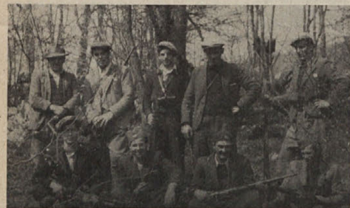
Borci udarnega voda Kočevskega bataljona ob napadu v Peklu, slikano v Kačjem potoku, 5. maja 1942

Že kmalu po ustanovitvi Kočevskega bataljona Notranjskega odreda 16. aprila 1942 na Preži, je bilo v navadi, da so za drzne akcije, kot so bili