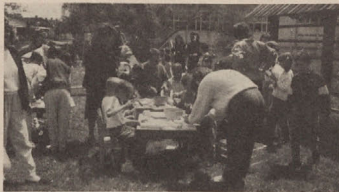
Pri igri so spretno pomagali tudi očetje!

V počastitev dneva mladosti je kolektiv vrtca priredil za vse predšolske otroke v občini Kočevje otroški »ŽIV-ŽAV«.