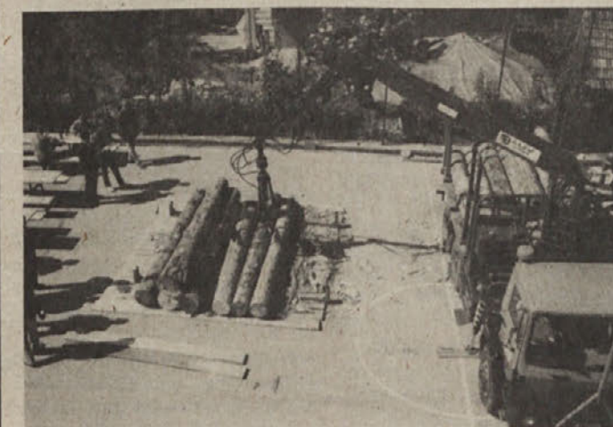
Pri nakladanju je potrebna spretnost

SODELUJMO V AKCIJAH ZA ZDRAVO IN ČISTO OKOLJE!