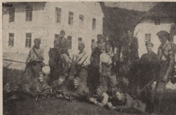
Borci Kočevskega bataljona po napadu karabinjske postaje v Koprivniku junija 1942

SKOJ, Mladini ali kateri drugi organizaciji Osvobodilne fronte. Včasih je bil za opravičilo tudi kriterij služenja vojaškega roka v kraljevini Jugoslaviji, čeprav so se v največjem številu javljali