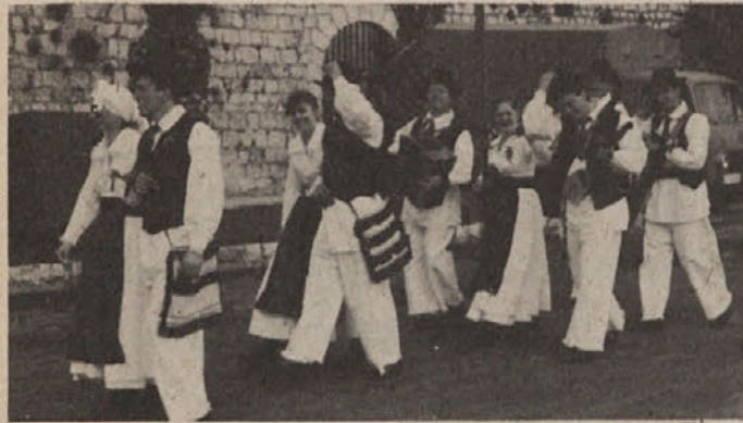
Kostelci so sodelovali na proslavi 100-letnice turizma na Rabu 20. maja 1989