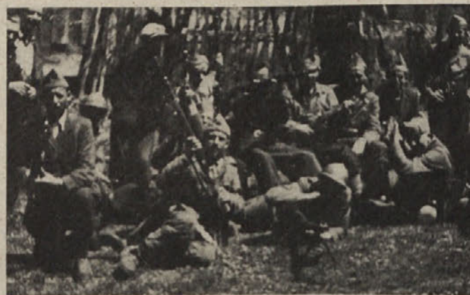
Borci Kočevskega bataljona junija 1942

»Pri napadu na Mozelj, 8. julija 1942, je večina našega udarnega voda uspela brez borbe vdreti v sredino vasi. Kmalu smo se spopadli z Italijani. Ko smo se pripravljali na juriš v hišo, v kateri so bili Italijani, je izven Mozlja začelo streljanje. Sami nismo vedeli, kaj se pravzaprav dogaja. Z nobeno enoto nismo imeli zveze, zato smo se odločili, da ne bomo jurišali. V kratkem času se je zbralo večje število sovražnikovih vojakov, kateri so nas močno napadli in prisilili na umik iz vasi proti Rajndolu. Ne vem, kdo je med umikom iz vasi dejal: »Sedaj pa smo tam, kjer ni muh!« Ko smo bežeč prišli na konec vasi, smo pod seboj zagledali vrsto sovražnikovih čelad; Italijani so ležali na obronku njive v zaklonišču. Kaj sedaj? Eni nas napadajo iz vasi, drugi pa nas čakajo nedaleč od vasi na dobrih položajih. Drugega izhoda ni, kot da se z borbo prebijemo proti