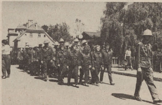
Slika prikazuje paradu gasilcev skozi mesto 10. junija 1989

V soboto, 10. junija 1989, so gasilci GD Kočevje proslavili 110. obletnico delovanja gasilstva. Za uvod v praznovanje je bilo v Gaju tekmovanje v gasilskih disciplinah in gasilskošportnih spretnostih. Sodelovale so ekipe GD Škofja Loka, Žabnica, Sora, Šalka vas in Kočevje. V gasilskih disciplinah je bila najboljša ekipa GD Sora iz občine Ljubljana-Šiška,