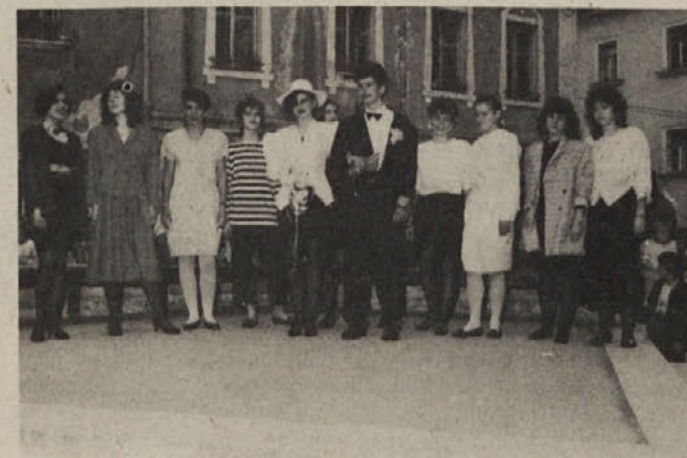
Prireditel v počastitev 27. aprila — dneva OF. Dijaki SŠTUD Kočevje so na modni reviji prikazali izdelke kočevskih butikov