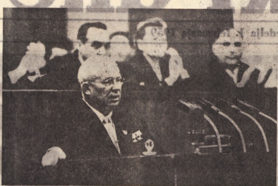
V Moskvi se kongres KP SZ nadaljuje. Na sliki prvi tajnik sovjetske partije Nikita Hruščev med čitanjem svojega šest ur trajajočega poročila