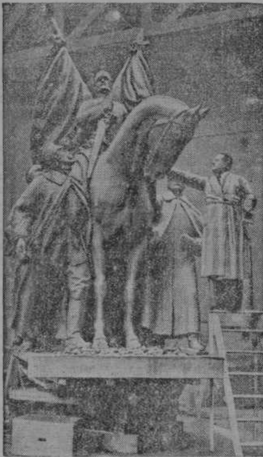
Spomenik kralju Aleksandru je delo pariškega kiparja Real del Sarthe.

oškodoval, pa če tudi je ukradel le samo kokoši. Koga bi ne prijela sveta jeza, če ne sme imeti niti kokoši nezaklenjenih?! Kdo je bil tat, bo sodnija dognala; jed-