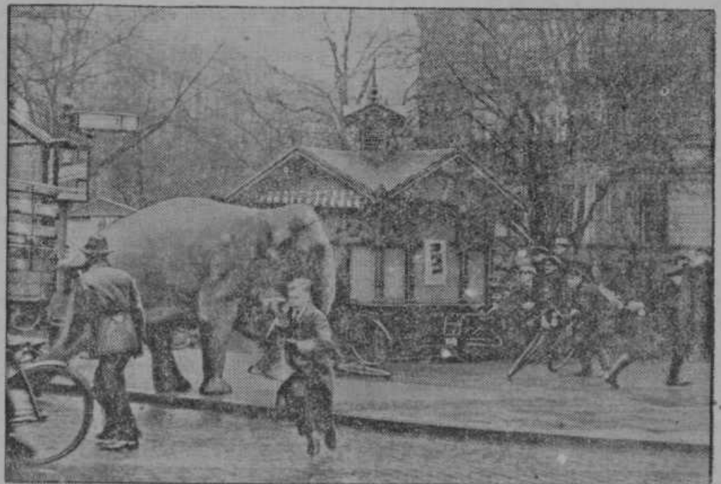
V Hamburgu je ušel slon iz cirkusa in je polomil več plotov in vrat.