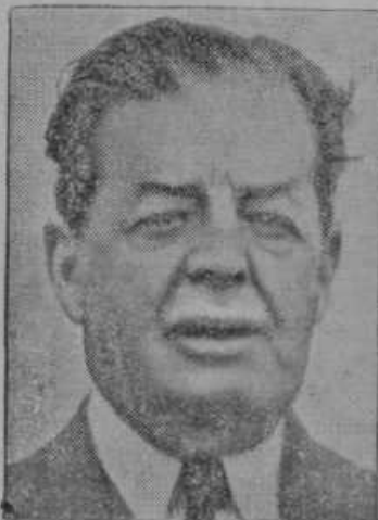
V Londonu je umrl angliški admiral Beatty. Rajni je bil eden največjih pomorskih junakov, ki je poveljeval angliški mornarici med svetovno vojno.