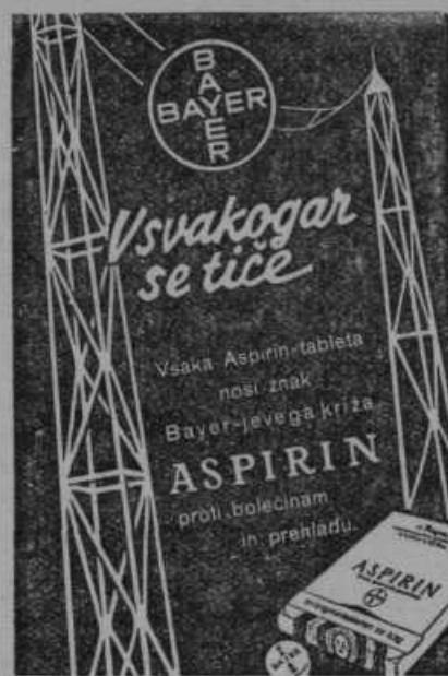
Oglas je registr. pod S. St. 1753 od 17. XII. 1935.

Vinski sejem in vinska poskušnja se bosta vršila v Ptujju dne 4. in 5. aprila t. l. v Društvenem domu in sicer ob priliki občnega zbora, ki ga bo imela Zveza gostilničarskih zadrug dravske banovine v Ptujju. Ptujjska vinarška podružnica, v kateri so vključeni večinoma vsi večji ali manjši vinogradniki iz Slovenskih goric in Haloz, hoče prav ob prihodu gostilničarjev pokazati, kolikoršno zalogo vina vseh kakovosti še posedujejo vinogradniki, ki bi radi po primernih cenah prodali svoj pridelek. Brezplačna poskušnja vin bo trajala dva dni in bo imel vsakdo priložnost, poskusiti vrsto vin. Razstavljenega vina bo nad 200 vzorcev. Dne 3. aprila se poskušnja otvori in bo trajala do 18. ure zvečer. Otvorila se bo ob 11. uri dopoldne. Dne 4. aprila pa bo trajala od 9. ure do 18. ure. Prilike bo torej dovolj, da se seznanijo producenti s konsumentami. Kupčije pa bodo lahko sklepali zlasti gostilničarji, ker si bodo lahko ogledali kraje osebno, kjer raste izborna kaplja Slovenskih goric in Haloz. Ker se bodo dne 4. aprila priredili izleti v te slikovite vinorodne kraje. Interesenti se lahko prijavijo Vinarski podružnici v Ptujju, vinogradniki pa dobijo prijave za udeležbo pri blagajniku g. Ljubecu v posojilnici v Ptujju, kjer se bodo sprejemali tudi vzorci, najmanj tri buteljke ene vrste. Dostavljene pa morajo biti v Ptuj do 28. marca. Pripomnimo pa, da se bo plačala le