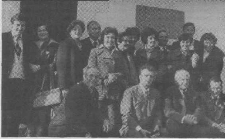
Pred spominsko hišo v Trebčah