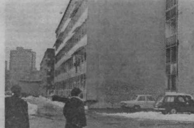
Nadzidave blokov so predvidene v Črtomirovi ulici 22, 23 do 25, 24 ter 27 do 29 in 31; v Neubergerjevi 16, 18 do 20 ter 22 do 24 in v Topniški 60 do 64.

V krajevni skupnosti Boris Zihel bodo v naslednjih dveh letih pridobili poleg novozgrajene Župančičeve jame še 111 novih stanovanj na nenačrtovani in do zdaj nepogost način. Gradbeno podjetje Giposs Inženiring bo nadzidalo obstoje-