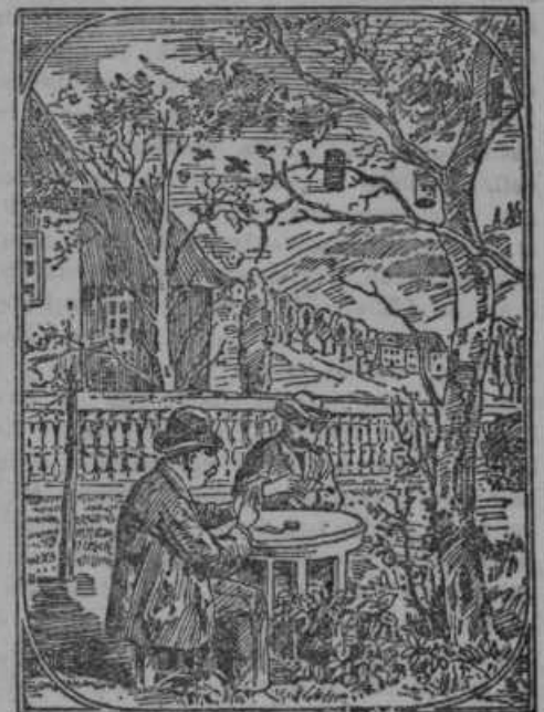
Kje je tretji igravec?