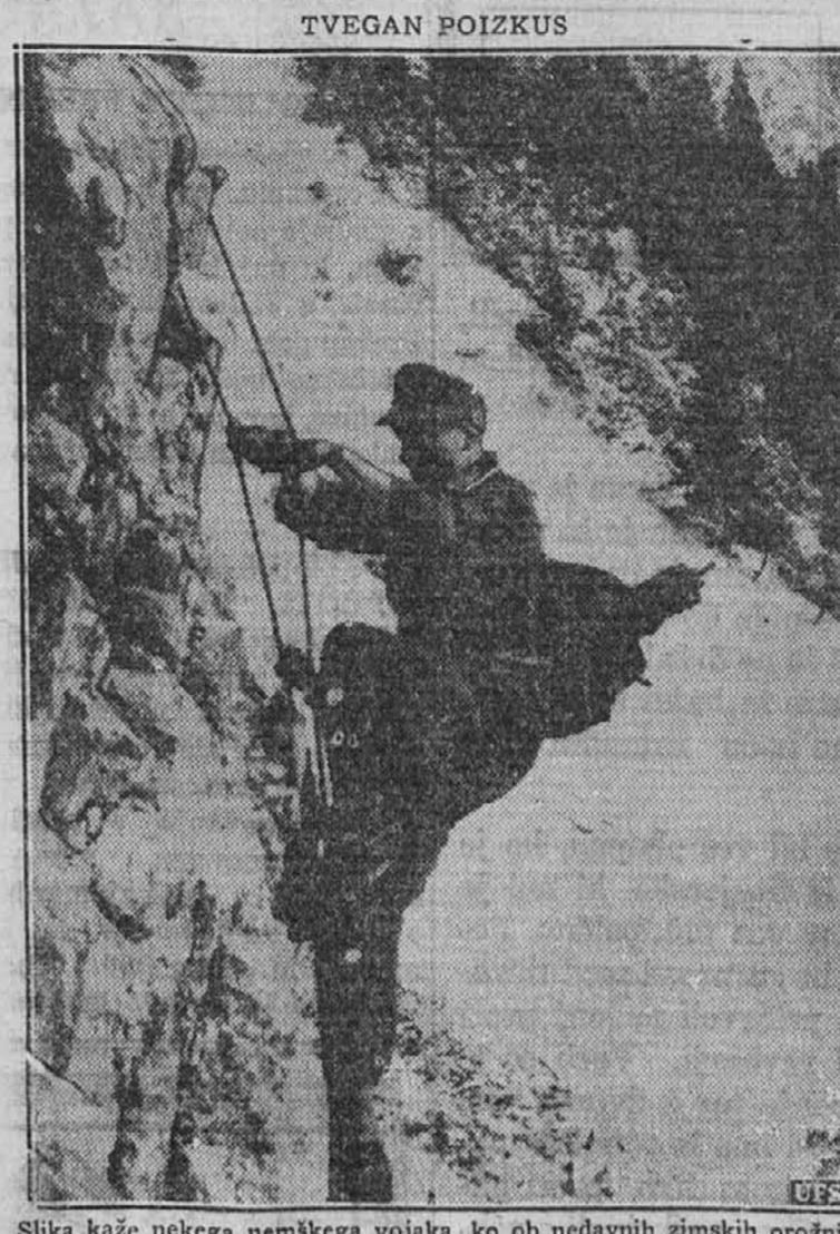
Slika kaže nekega nemškega vojaka, ko ob nedavnih zimskih orožnih vajah v Bavarskih Alpah pleza po visoki strmini s pomočjo vrvnate lestve. Stojec kje v nižini na varnem, brzkone opazuje ta nevarni poizkus kakih par generalov.

V slovenskem delu Koroške so se prvič pojavili nekateri