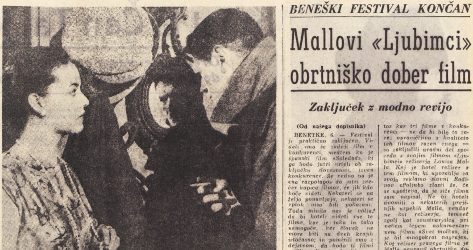
Jeanne Moreau (Jeanne) in Alain Cuny (Henry) v filmu «Ljubimci»