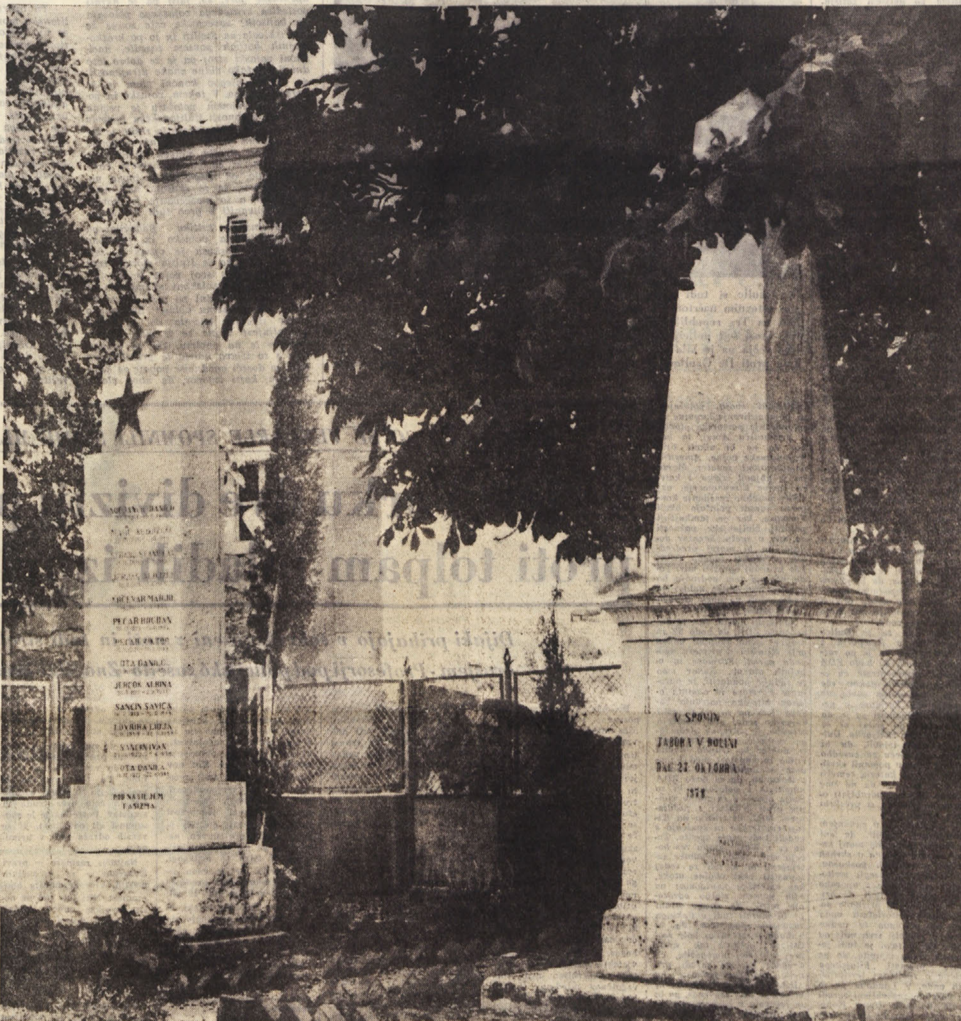
Danes praznujemo tržaški Slovenci osemdesetletnico dolinskega tabora (28. oktobra 1878) poleg osemdesetletnice dolinskega prosvetnega društva »Valentin Vodnik«. Dolinski tabor je važen datum v zgodovini vseh Slovencev, v taborski dobi, ko so »mladoslovenci« iz nezadovoljstva do politike »staroslovencev« (ki so nastopali pod geslom »Vse za vero, dom in cesarja!«) prirejali »narodne« tabore in razvili svoj politični program: Zedinjena Slovenija, narodna enotnost in poudarjanje bratstva Južnih Slovanov proti nemško-madžarskemu zatiranju. Na fotografiji vidite spominsko piramido v Dolini in poleg nje spomenik padlim dolinskim borcem v narodnoosvobodilni vojni, ki je bila logično nadaljevanje borbe za uresničenje programa dolinskega tabora.