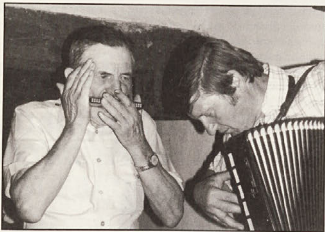
Jerclova muzikanta na zaključnem večeru v kuhinji podsreškega gradu.

Udeleženci so vsak dan sproti urejali pridobljeno gradivo (terenske zapiske, skice, risbe); vse pridobljene predmete so inventarizirali. Fotografije, ki so jih študentje in njihovi mentorji posneli v delavnici, so sproti razvili in nato uredili.