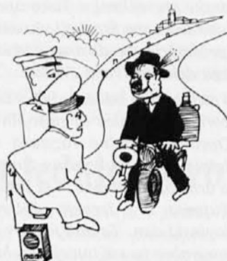
- Ste znoreli, sedemdeset, pa po takem bregu!