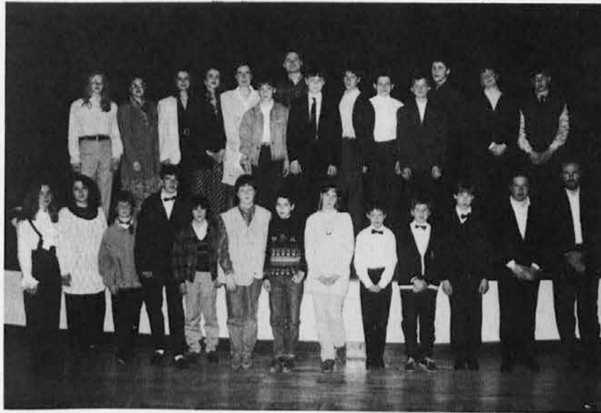
Nastopajoči na odru Katoliškega doma