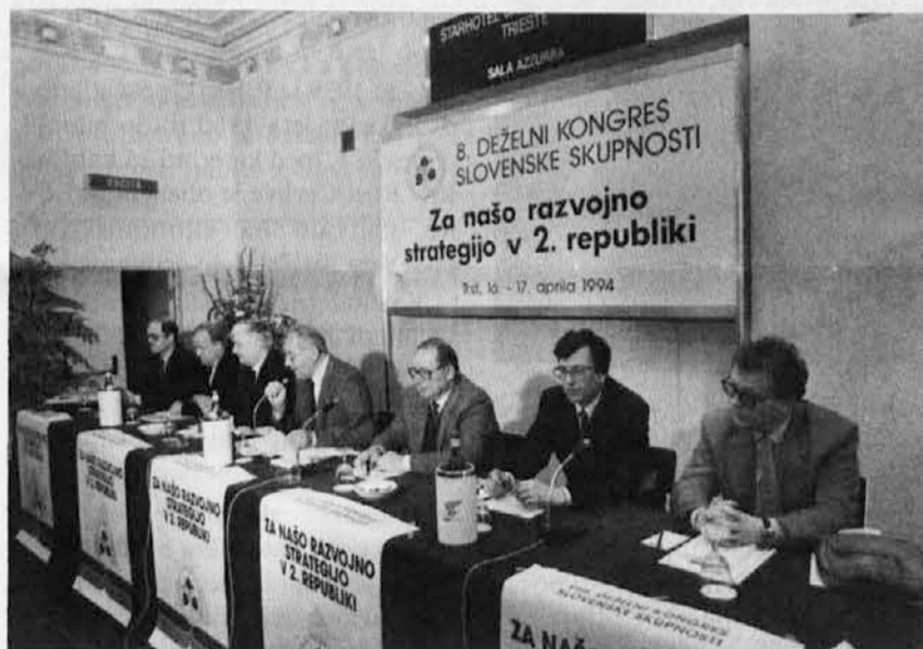
Vodstvo SSK na 8. deželnem kongresu