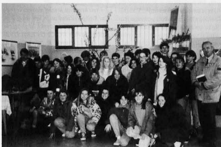
Srečanje srednješolcev iz Gradca in Nabrežine v župnijski dvorani v Nabrežini.