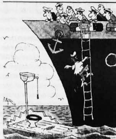
- Rešila me je zaloga sladke vode