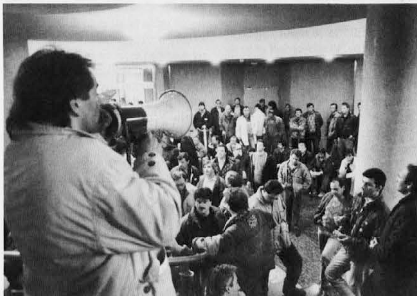
Delavci Arzenala - Sv. Marka so za nekaj časa zasedli v znak protesta Pomorsko palačo. Njihov boj za pravice se še nadaljuje.