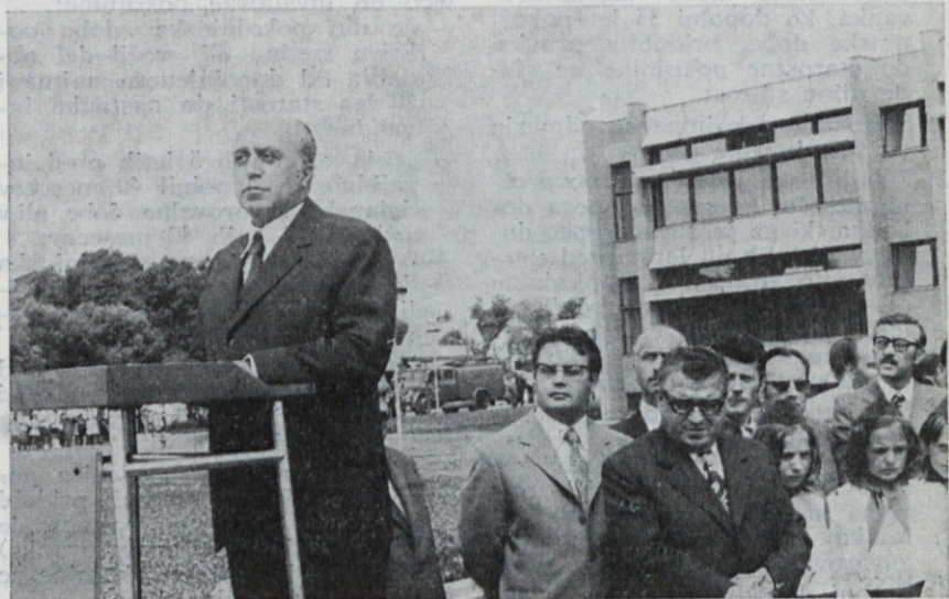
Pomembna pridobitev našega osnovnega šolstva — nova šola na Rojah, ki je zgrajena tudi z našim samopriskevkom