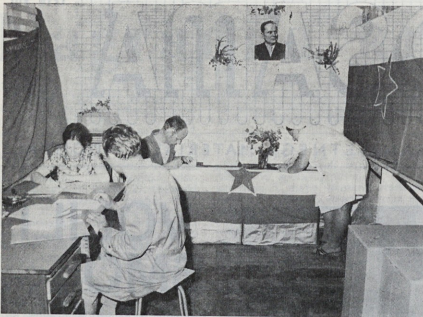
....pri filtrih in še kje!