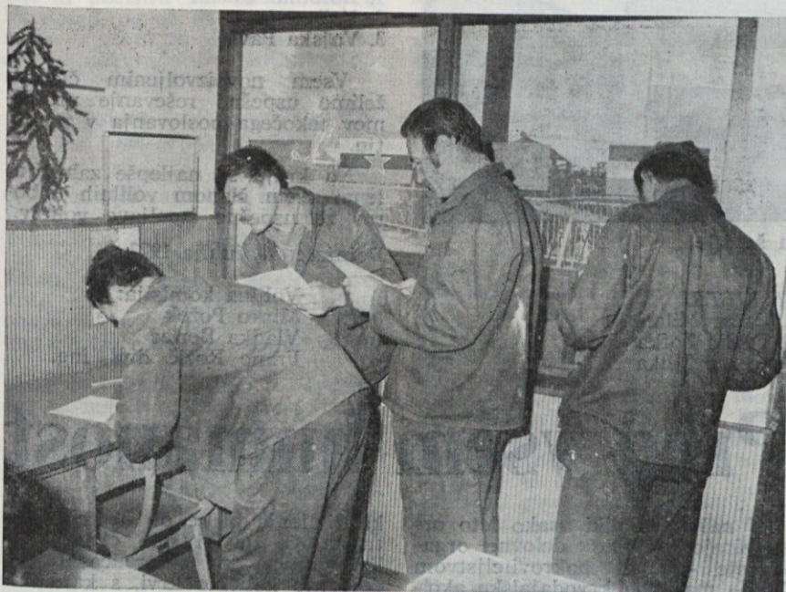
Volili smo . . .

Kot nam je znano, volimo vsake dve leti nove člane v samoupravne organe.