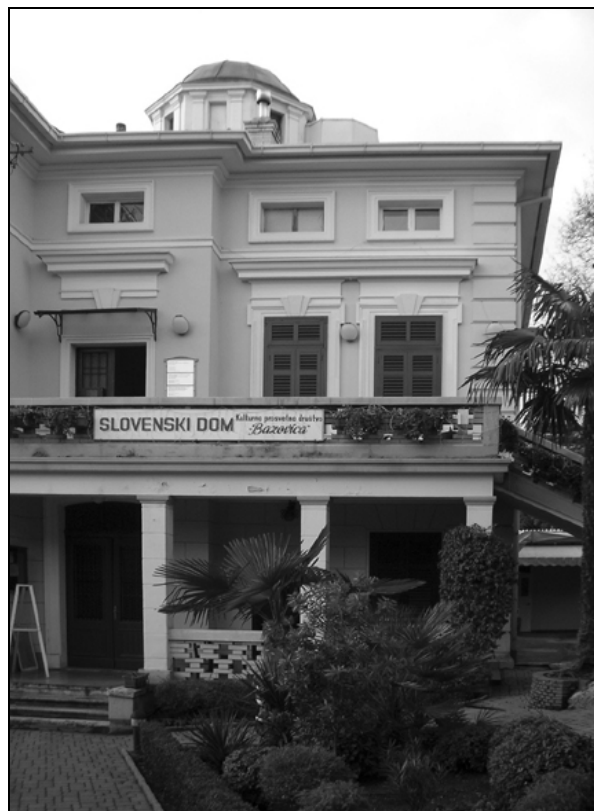
Slovenski dom na Reki – novi vhod na vzhodni strani.