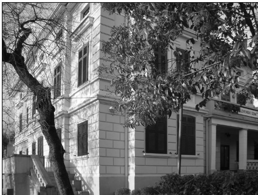
Slovenski dom – južni in vzhodni del (foto: Marjana Mirković).

Naslednji zapis o društvu je bil v Rijeckem listu objavljen 18. maja v prispevku z naslovom Aktivnost Doma kulture Prvog rajona Rijeke , ocenjuje pa proslave v kulturnih domovih na območju I. rajona, organiziranih v počastitev 30. obletnice KP Jugoslavije in Prvega maja. Ob koncu posebno pozornost namenja "nedavno odprtemu, novemu kulturnemu domu Giuseppe Carabino, ki je nameščen v primernih prostorih, na razpolago pa ima tudi knjižnico in čitalnico. Knjižnica ima 542 knjig v italijanščini in hrvaščini, čitalnica pa je naročena na štirinajst različnih časopisov in revij, ima pa tudi dva šaha". Sledi navedba o slovesnem odprtju prostorov in umetniškem delu programa – v njem je med drugimi nastopilo tudi pevsko društvo Bazovica – ter dobrem obisku, saj se je proslave udeležilo "več kot 250 obiskovalcev. Z novim kulturnim domom je ta del Reke pridobil novo kulturno ustanovo, ki ji bo potrebno pomagati po vseh močeh, da bi dejavnost že na začetku zaživela v polnem razmahu, kajti odbor je svojo pripravljenost pokazal že pri ustanovitvi", 24 toda nadaljnje objave v Rijeckem listu tega ne potrjujejo. Dejavnost je bila usmerjena v občasne prireditve in predavanja: za 26. julij 1949 je bila tako v počastitev osemletnice vstaje na Hrvaškem 25 napovedana "proslava, ki jo v kulturnem domu Carabino za krajevne organizacije pripravlja Slovenski klub Bazovica". 26 Večino dejavnosti je organizirala Ljudska univerza I. rajona, ki je v tisku napovedala več predavanj: za 6. oktober z