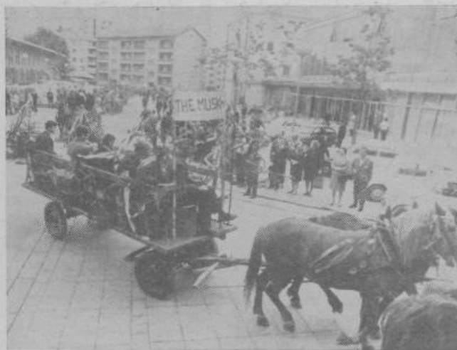
GAUDEAMUS IGITUR... Po stari tradiciji so se četrtošolci šentvidske gimnazije tudi letos poslovili od srednje šole — s povorko na petih kmečkih vozovih in na predpoptnem avtomobilu.

TUDI TO BI LAHKO BILA TURISTIČNA ATRAKCIJA