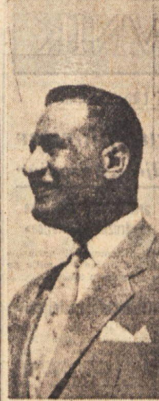
Predsednik egiptovske republike Naser, ki je s svojim sklepom podpravljenju Sueškega prekopu povzročil novo krizo v zahodnem svetu