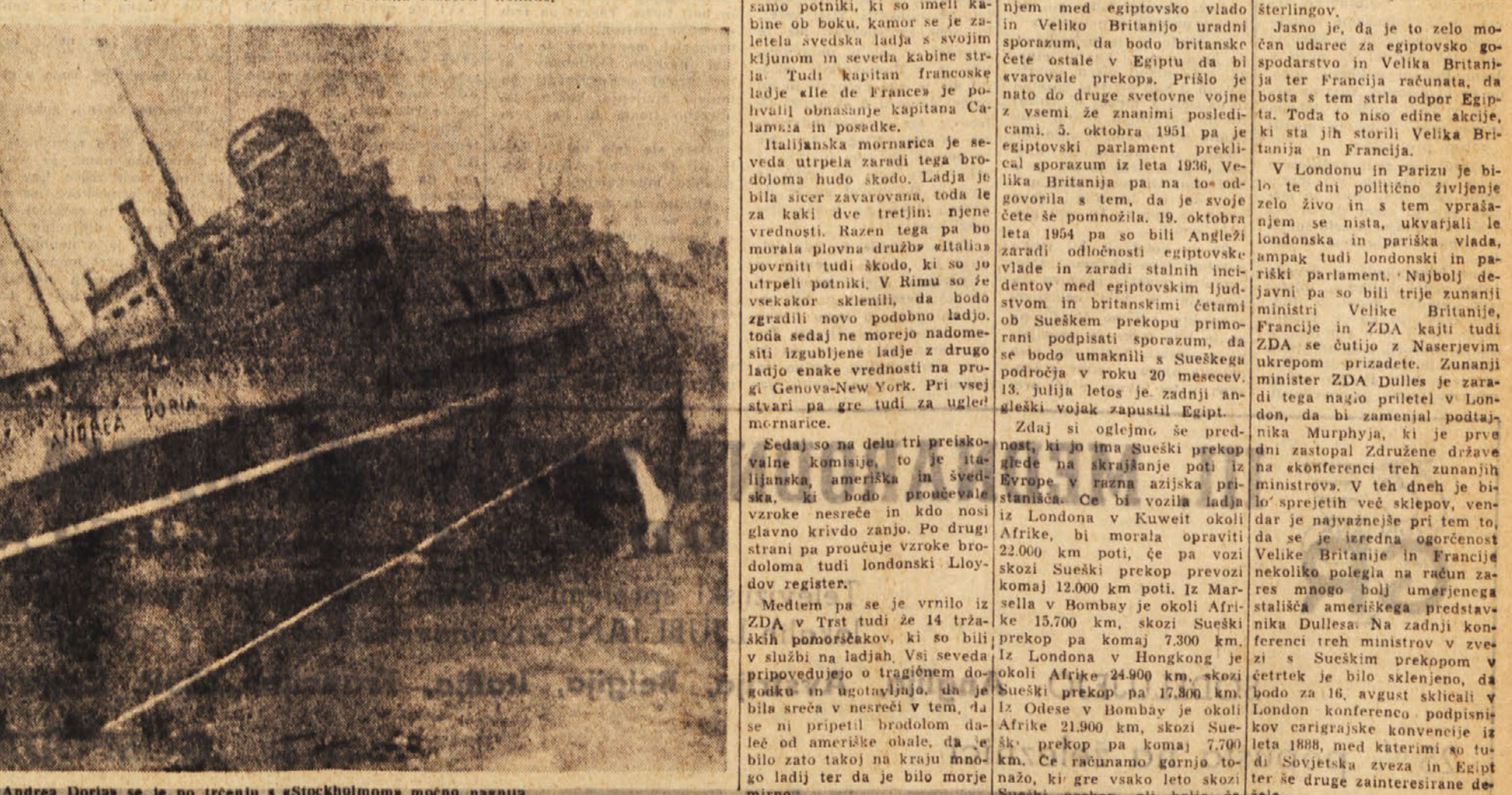
Ladja «Andrea Doria» se je po trčenju s «Stockholmom» močno nagnila