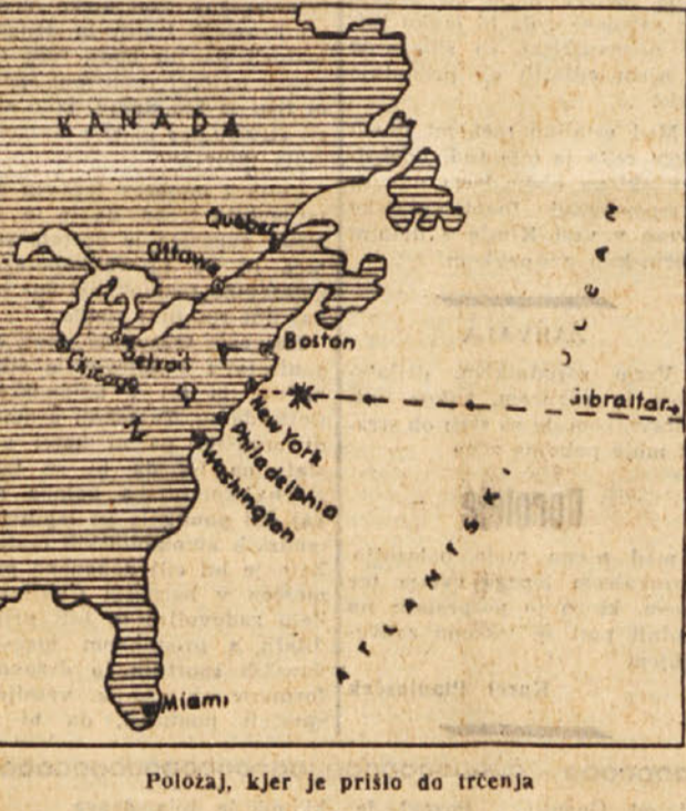
Položaj, kjer je prišlo do trčenja

Kmalu po nesreči so se vnele v časopisju polemike o njenih vzrokih in vsaka stran je pač tolmačila dogodek po svoje.