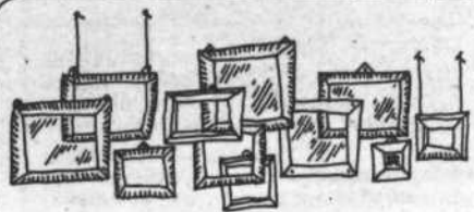
RAZSTAVE ZA BEŽIGRADOM