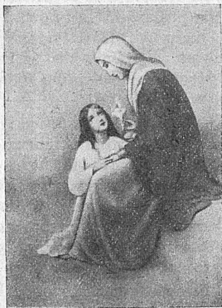
Sv. Ana z brezmadežno hčerko.