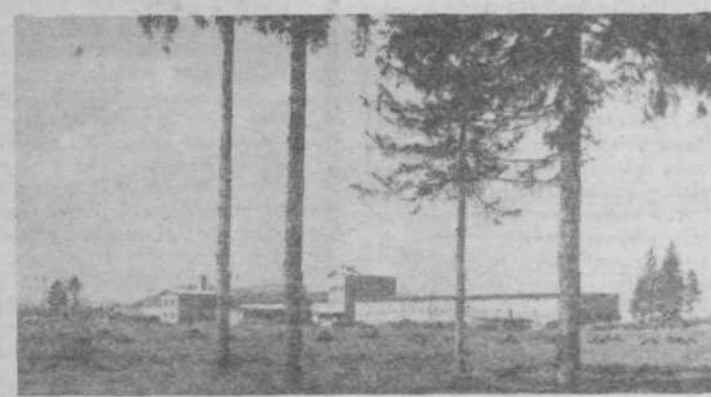
Zalaška farma — tako se je začelo pred 25 leti.