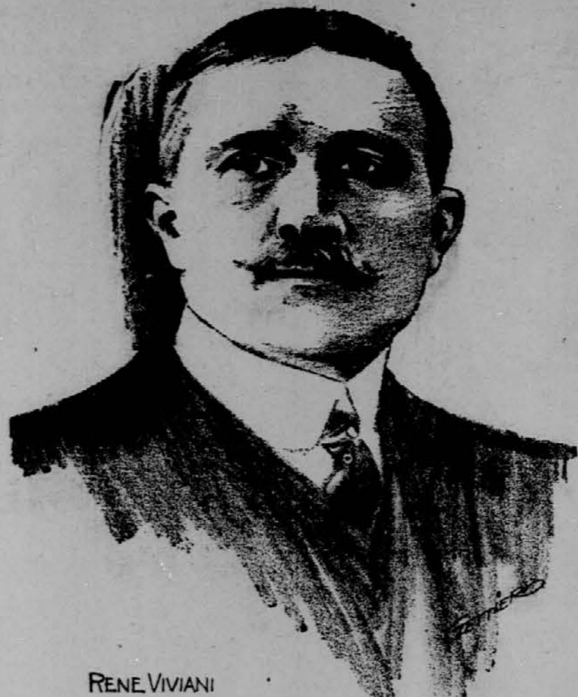
RENE VIVIANI Rene Viviani, francoski justični minister.