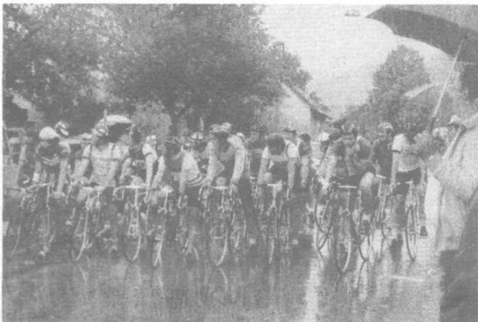
Kljub gneči na startu ni bilo težav

Torej bo v perspektivi teh letovišč čedalje manj. V Pacugu pa se nam obeta stalna rešitev omenjenega območja, ki je v projektu za severni Jadran namenjeno kot rekreacijski prostor za otroke in mladino. Upamo, da bodo s pobudo predsedstva OK SZDL uspeli, seveda ob pomoči in sodelovanju občanov in delovnih ljudi samoupravno organiziranih v KS in OZD naše občine.