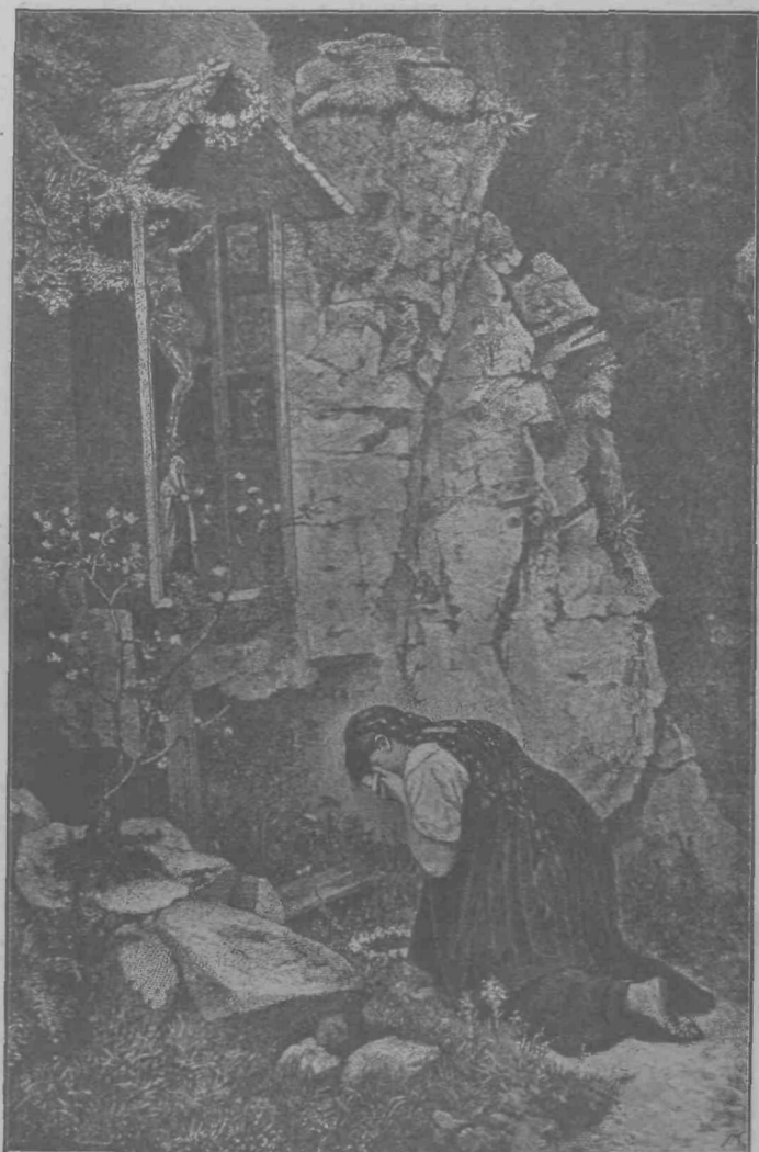
Iz knjige trpljenja.