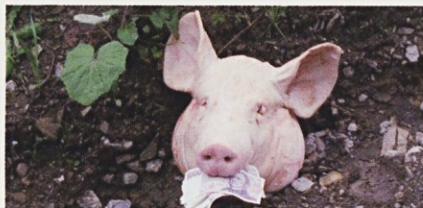
Vse za dobro tega sveta in Nošovic