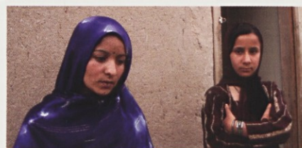
Prodali so me za 50 ovac