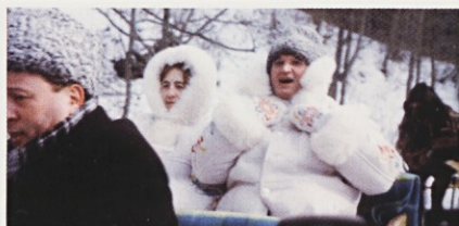
Avtobiografija Nicolaeuja Ceausescuja