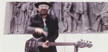
V letu hip hopa

prikrajal za obdelovalno zemljo in namesto blaginje prinesel brutalno obliko kapitalizma. Namesto delovnih mest za vaščane predstavlja tamkajšnja tovarna za mnoge neznani leteči predmet sredi nekoč bogatih obdelovalnih površin. Odziv vpletenega režiserja na življenjske posledice ljudi v globalnem kapitalizmu je izrazito lokalni, a zato nič manj produktiven. Film z bonus dodatkom preveva groteskni občutek za humor, ki je očitno še edino, na kar se lahko zanesejo prebivalci Nošovic.