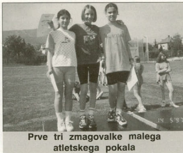
Prve tri zmagovalke malega atletskega pokala