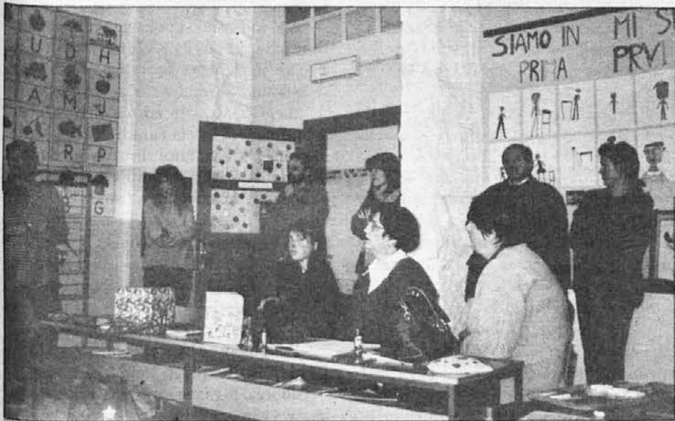
Dvojezična šola v Špetru.