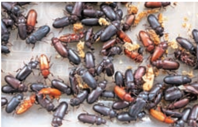
Vloga odraslih mokařev je razmnoževanje živali.

V podjetju Mokař iztrebke mladih mokařev že predelujejo v organsko gnojilo fraso, ki ga bodo dali na trg pod blagovno znamko Frasko. Gnojilo ima po besedah sogovornikov veliko dobrih lastnosti: je naravno, brez neprijetnega vonja, prepro-