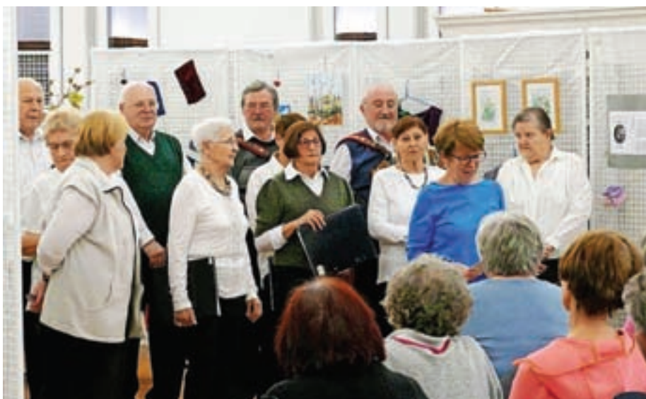
Utrinek z odprtja razstave

»Tema letošnje razstave je Konec zime. Že naslov pove, da se ročnim delom največ posvetimo čez zimo, ko ni dela na vrtu in je manj možnosti za zunanje aktivnosti. Marec pomeni konec zime in zato lahko sedaj pokažemo, kaj smo naredile. Ljubiteljice pletenja in kvačkanja so spletle in skvačkale lepe in