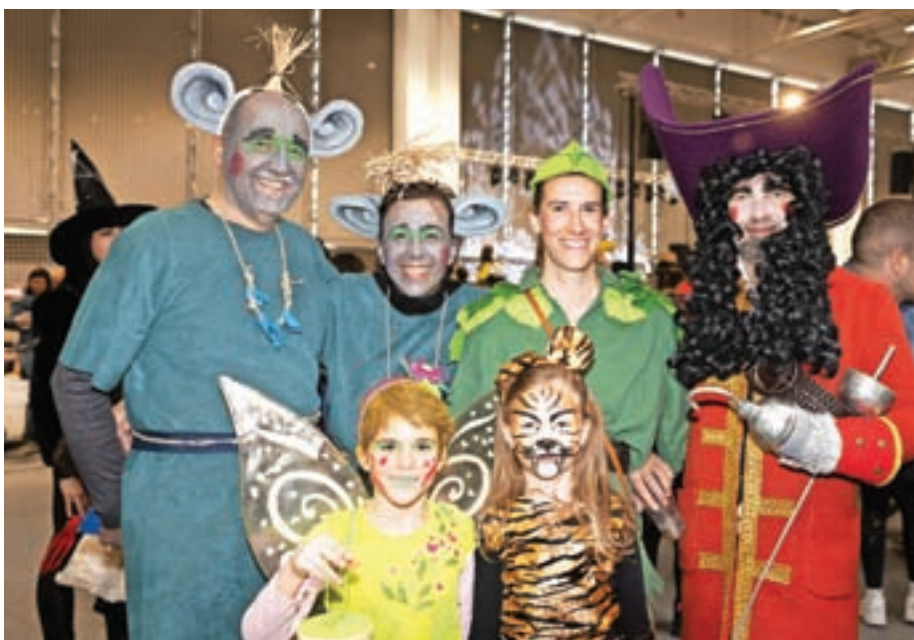
Peter Pan, kapitan Kljuka, Zvončica, tiger in trola iz Medvod