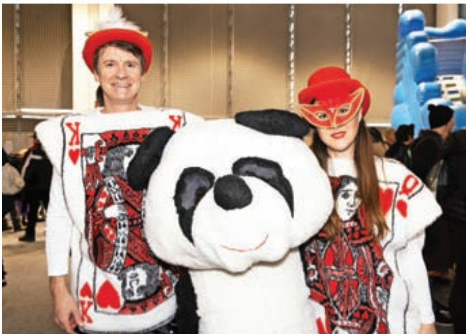
Veliki panda in igralni karti iz Zbilj / Foto: Peter Košenina