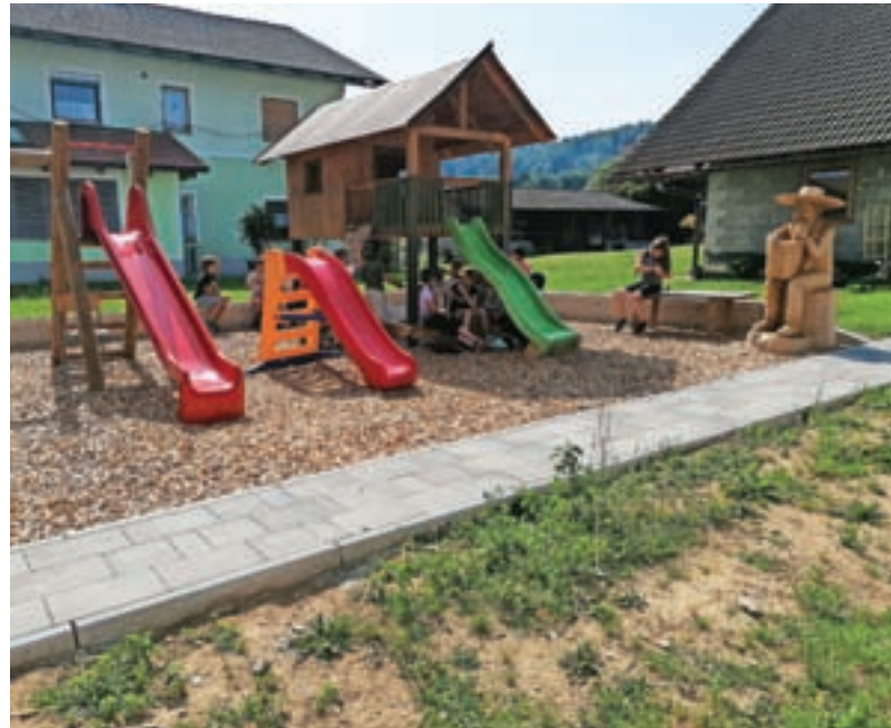
Rezultat projekta so tudi nova otroška igrala, ki so dobro obiskana.

Projekt so sofinancirali Republika Slovenija, Evropski kmetijski sklad za razvoj podeželja in Evropski sklad za regionalni razvoj.