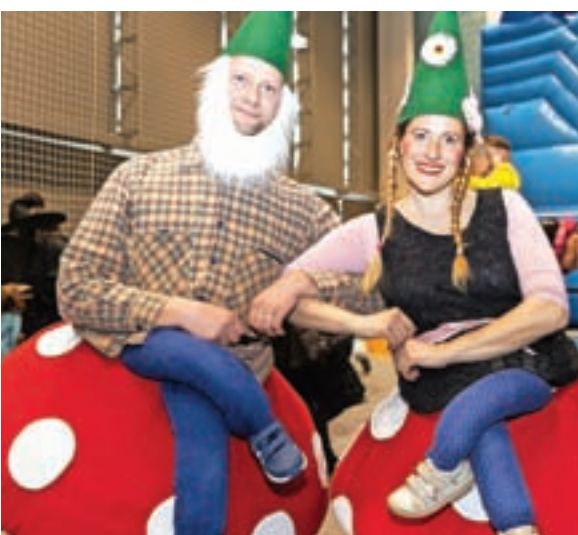
Palčka na gobi iz Sore