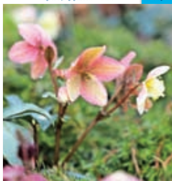
Prihaja pomlad.