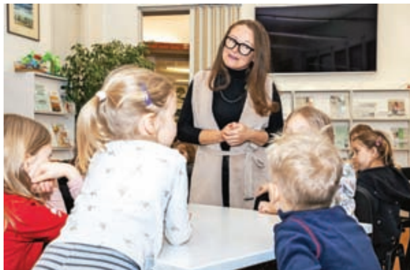
Pravljične urice v Knjižnici Medvode so dobro obiskane.