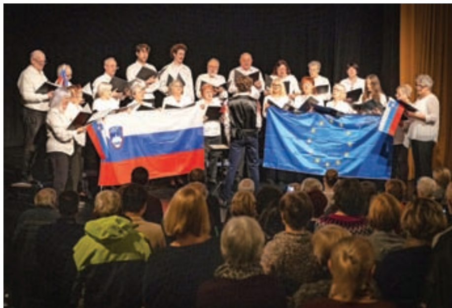
Mešani pevski zbor Jakoba Aljaža je na koncertu v Medvodah pel domoljubne pesmi.