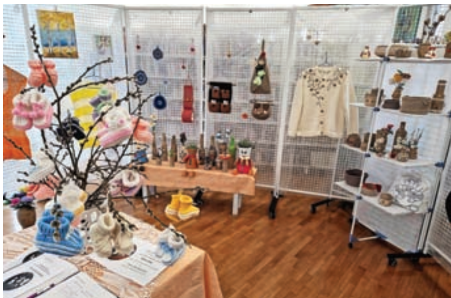
Razstava bo na ogled do 19. marca.