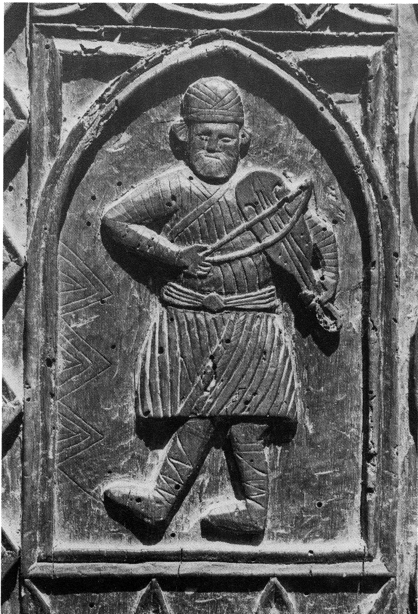
3 Treskavac (16. vek). Dvokrilna drvena vrata: svirač u violinu(?)