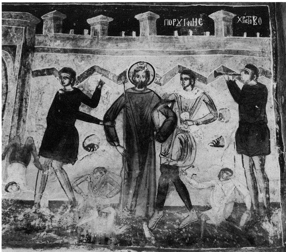
4 Prorok Ilija u Boboševu (1678). Rujanje Hristu: svi-rači u bubanj i zurle