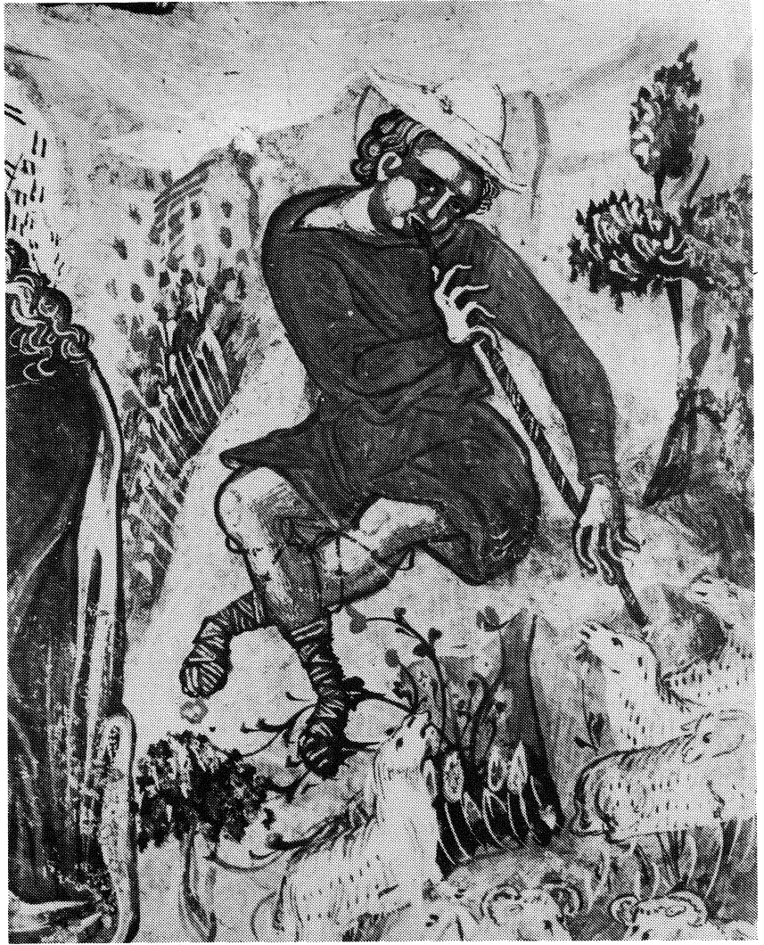
2 Manastir Varlam, katolikon, Meteori (16. vek). Hristovo rodjenje: svirač u kaval (detalj)