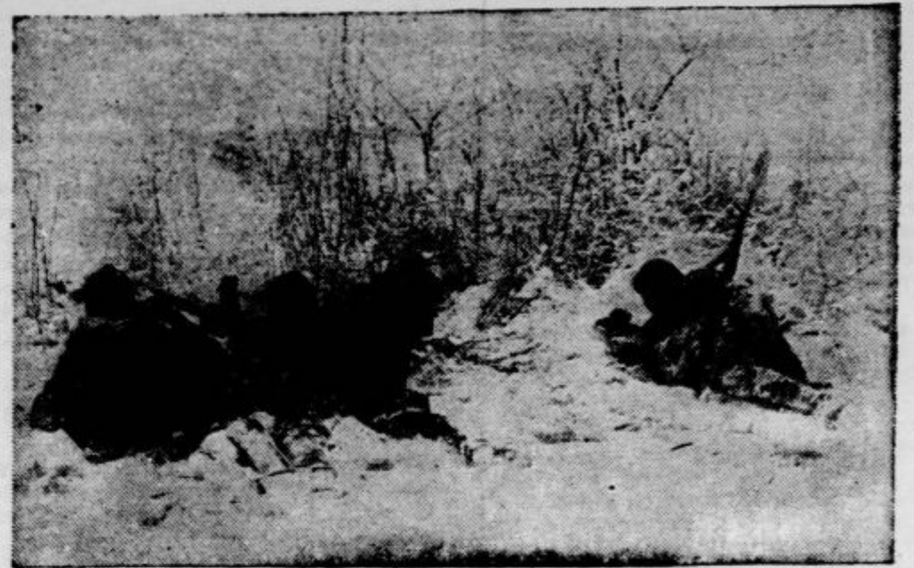
Posnetek z zapadnega bojišča. Francoska vojaška patrulja straži postojanko s strojnico