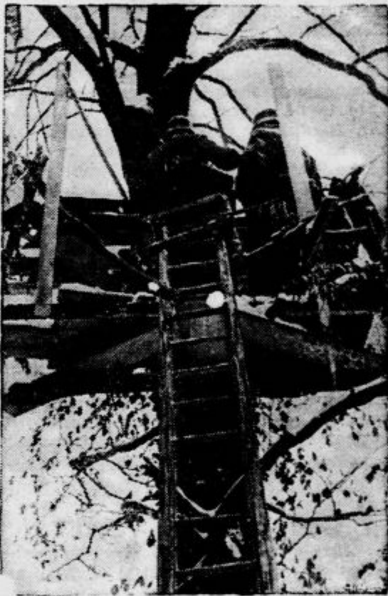
Sodobna vojna ne pozna obzrov do človeškega življenja. Če zahteva položaj, mora vojak vršiti stražno službo celo na drevesu, kakor kaže ta posnetek z nemške strani zapadnega bojišča