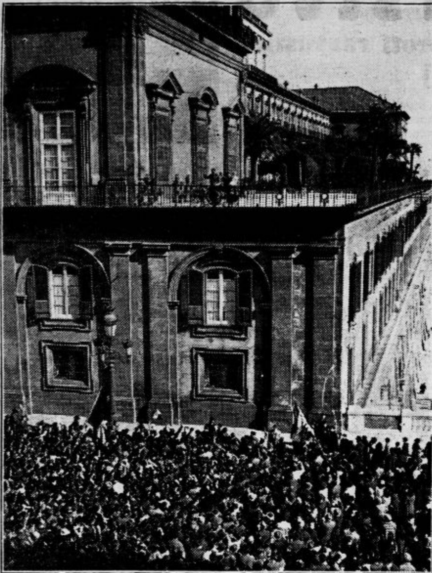
Množice manifestirajo pred palačo v Napolju, kjer je Piemontska princesa v nedeljo povila svojo najmlajšo hčerko