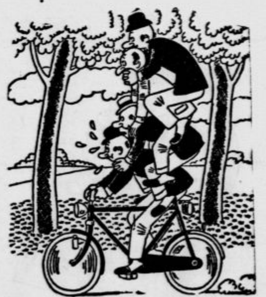
Možakar, ki je pred nekaj mesci povabil svoje prijatelje na izlet z avtomobilom...