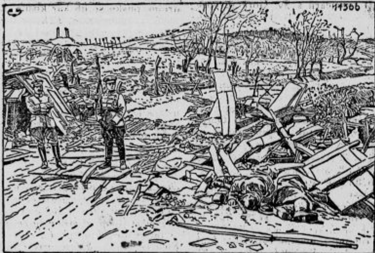
Od naših zasedena poljska utrdba.

Vzvišena naloga kranjskih ženâ je sedaj, da zastavijo svoje moči v korist te dobre stvari in sicer ne le s tem, da redno pomagajo v obliki prostovoljnega ženskega vojnega prispevka, marveč tudi z dejanskim sodelovanjem, in sicer s tem, da poizvedujejo o družinskih in premoženjskih