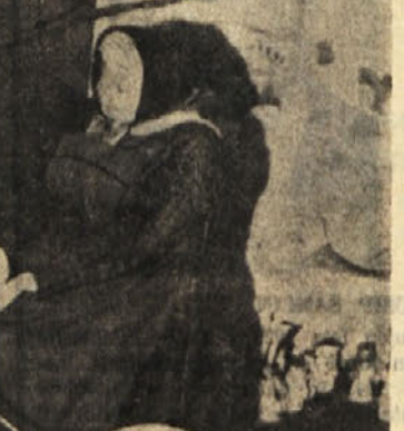
Latke v narodnih nošah na razstavi v Dolu