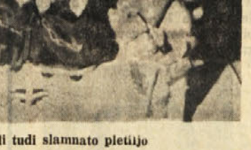
va razstavi so prikazali tudi slamnatu pletiljo