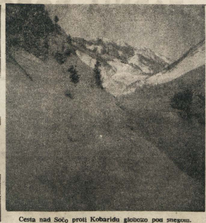
Cesta nad Sočo proti Kobariču globoko pod snegom.

ti, ki je odinjal v njem vsepovsod sledove svoje mehke duše. Slovenji Gradec, upravno središče osvojenega dela Koroske, je bil zadnja postojanka na najinem izletu po koroskih gorah in dolinah. V Starem trgu in na gradu, ki sta praznaprav prvotni Slovenji Gradec, so našli ostanke keltske, rimske in pravoslavne naselbine, mesto samo je pa tudi praznapravlo 700-letnico svojega obstoja in spada med najstarejša pri nas. Kljub temu pa v primeri s svojimi sovostniki ne kaže danes prav nič srednjeveškega lica, morda prav zaradi številnih popravil, ki so v preteklosti razsajali nad mestom, pa zaradi izredno ugodne lege na prostorni ravnini, ki bo Slovenjmu Gradcu tudi v bodoče omogočila nemoten razmah in razcvet. Mesto ima vse, kar si more poželeti: lep, sončen glavni trg, železnica z dvema postajama, nižjo gimnazijo, lastno bolnico, celo moderno kopalnice ter vrsto dragocenih zgodovinskih in umetnostnih spomenikov, izmed katerih sva si uteg-