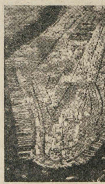
Polotok Manhattan, najstarejši del New Yorka.

Razumljivo je, da so mestu, kot je New York, potrebne vsake delikatesne količine hrane. Zato ponosi, medtem ko največji del prebivalstva spi, prihajajo v New York celi reke velikih kamionov z vseh strani newyorške okoline, največ pa iz sosednje države New Jersey in dovažajo hrano. Statistika pravi, da porabi New York letno skoro milijardo kg mesa, četrt milijardo kg rib in skoro dve sto milijonov ducaov jaja. Mesčani popijejo dnevno okrog pet milijonov litrov mleka. Piva in ostalih alkoholnih in brezalkoholnih pijavc popijejo toľko, da bi bile potrebne številke z mnogimi ničla-