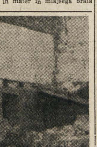
Na ruševinah doma v Borjani.