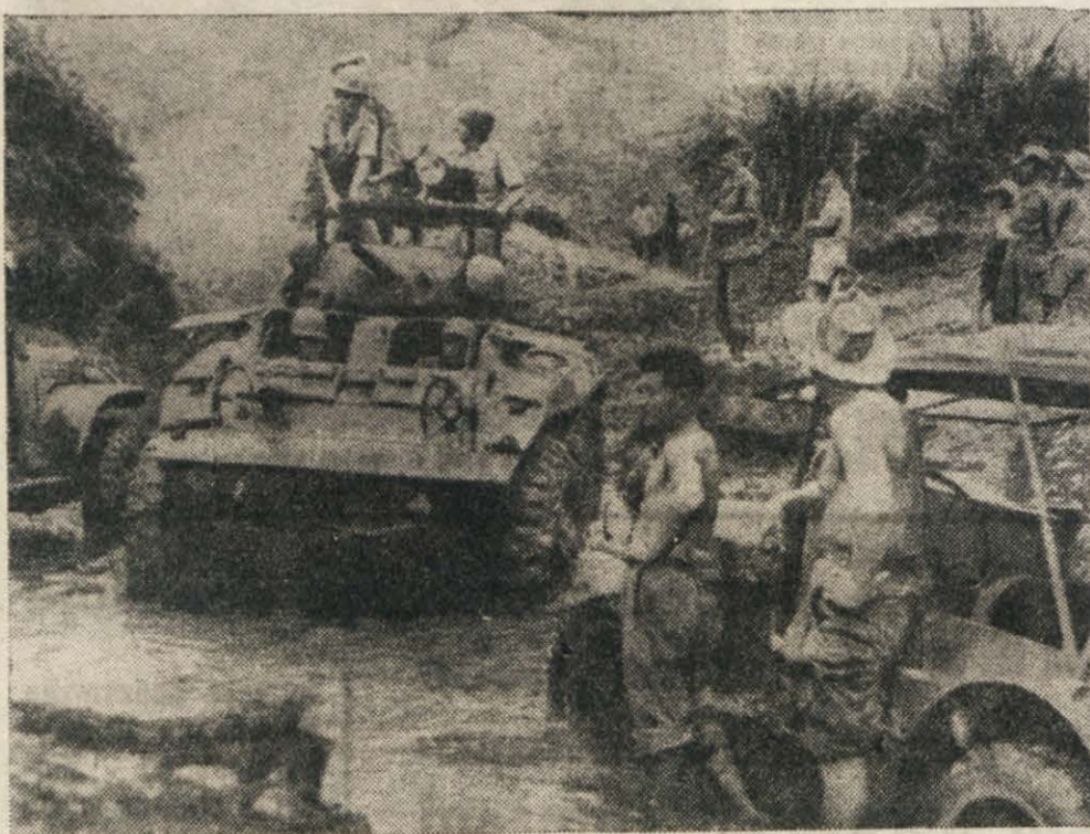
Vietnamski uporniki so spreminili ceste v Tonkinu in Indokini v pravzaprav hudournike s tem otežili premikanje vozilom in tankom francoskih čet. Na sliki: cesta v pokrajini Hoabinh, prepričljiva z dočki Črne reke.