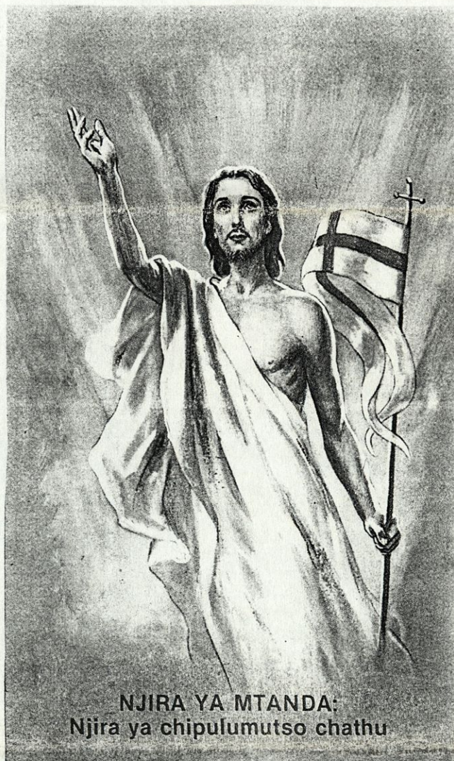
NJIRA YA MTANDA: Njira ya chipulumutso chathu

Letošnja Velika noč je prav posebna. Že v koledarju vidimo, da bo to zadnja Velika noč v tem tisočletju. V tem letu bomo Slovenci dobili svojega prvega svetnika v osebi škofa Antona Martina Slomška. To leto nas bo popeljalo globlje v združeno Evropo. Naš misijon v Nangomi bo doživel svojo pomlad, saj se slovenska cerkev in slovenska država zavezujejo, da ga bodo polnomočno podprli. Vsi ti dogodki so povezani z upanjem, ki ga navdihuje Velika noč-Vstali Kristus! Ostane pa večna resnica: Križev pot je še vedno pot našega odrešenja. Aleluja!