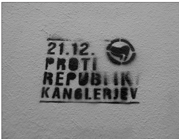
Grafit 21. december 2012 – proti republiki kanglerjev

Ti in številni podobni grafiti/nalepke so pozivali k organiziranju, nanašali pa se niso zgolj na vstajniški čas in posamezne proteste, temveč so nagovarjali k dolgoročni (samo)organizaciji onkraj obstoječega sistema. V anarhističnih/avtonomističnih krogih je koncept samoorganizacije vgrajen v same temelje in se kot praksa vsak dan uveljavlja v raznolikih kolektivih (bodisi prek DIY , food not bombs , skvotiranja