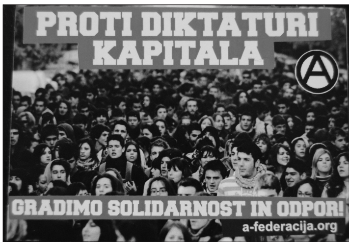
Nalepka Proti diktaturi kapitala gradimo solidarnost in odpor

Skladno z nasprotovanjem obstoječi sistemski ureditvi je veliko uličnih zapisov/nalepk nastalo kot odgovor na policijsko nasilje in represijo državnih organov nad vstajniki. 8 Policija je na nalepkah in grafitih predstavljena kot sistemski lakaj,