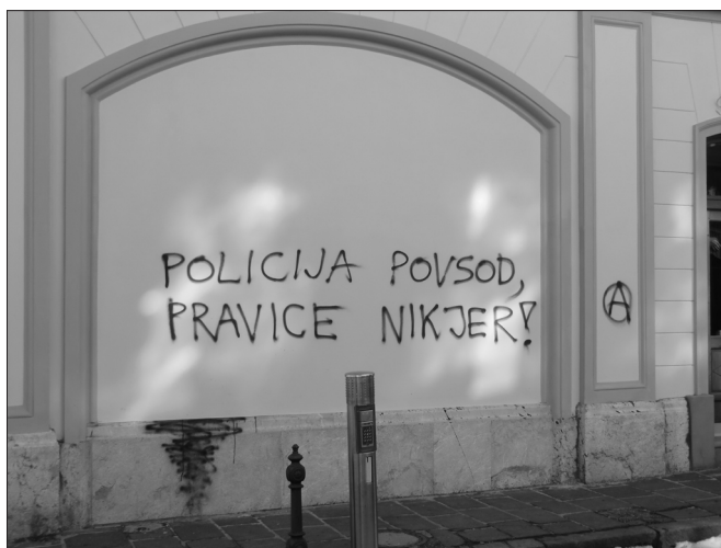
Grafit Policija povsod, pravice nikjer

in strank (tudi tistih v nastajanju): Ne rabimo nove vlade, ampak nov način odločanja in Moč ljudem, ne strankam, Nikoli sluga, nikoli gospodar! ali pa Kapitalizem na referendum! #Vstaja , z anarhističnim A. Nalepke so bile večinoma v (anarhistični) rdeče-črni kombinaciji. Strankarski sistem je bil skozi