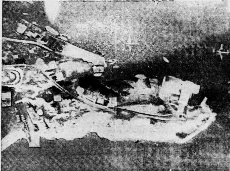
Angleški bombnik nad Bergenom v trenutku, ko je odvrnil bombo na pristanišče