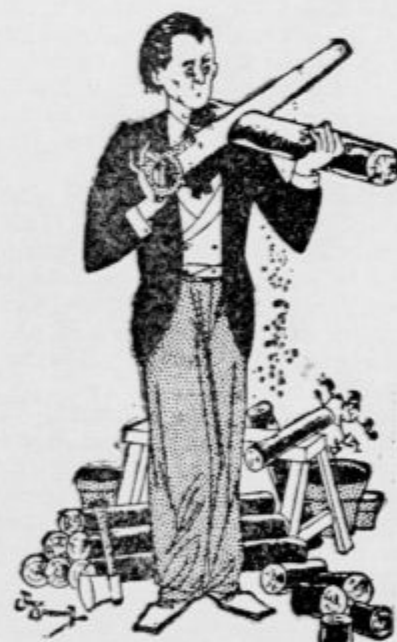
Goslač žaga drva za svoje gospodinjstvo.

Usnjene ročne torbice očistimo najbolje, če jih nadrgnemo s sočno čebulo.