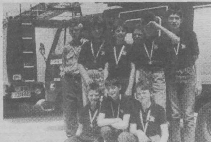
Pionirji po osvojitvi tretjega mesta na letošnjem občinskem prvenstvu

večjih požarov nujno potrebna. Vedeti je treba, da je v Zalogu mnogo gospodarskih objektov, na ranžirni postaji pa se iz dneva v dan premikajo vagoni z nešteti vnetljivimi snovmi. In v pri-