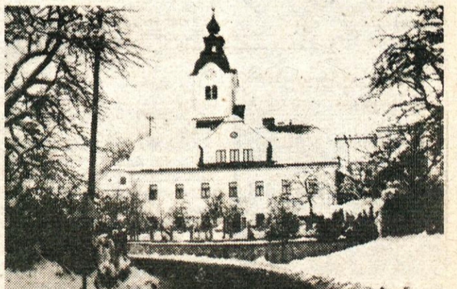
Župnišče in cerkev v Komendi