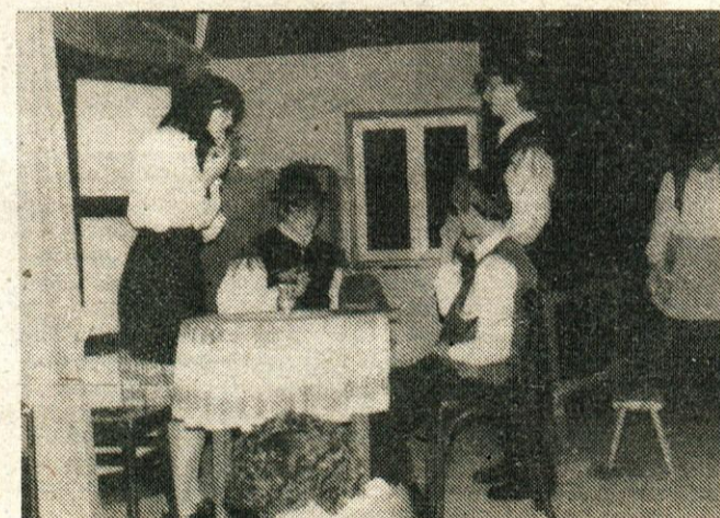
... Moja volja bi že bla, pa za mamco se ne ve