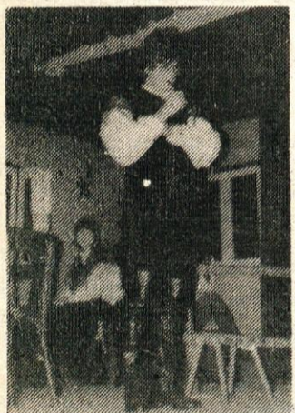
Kaj boš revca ti goljufala, nisi lepa nisi zala