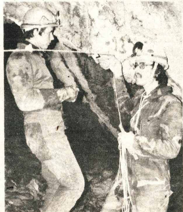
Merjenje v Kamniški jami