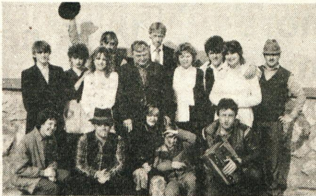
Igralska skupina pred prvim nastopom v Komendi