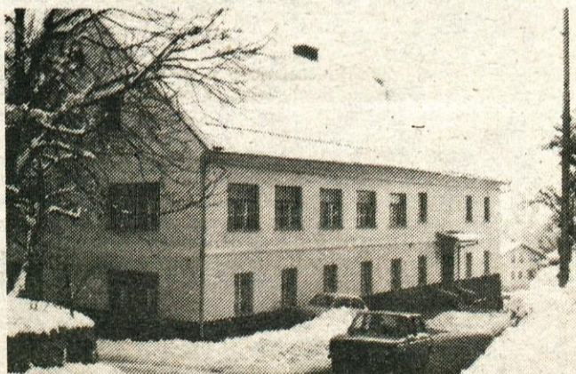
Obnovljena zgradba, kjer je bila Glavarjeva bolnica