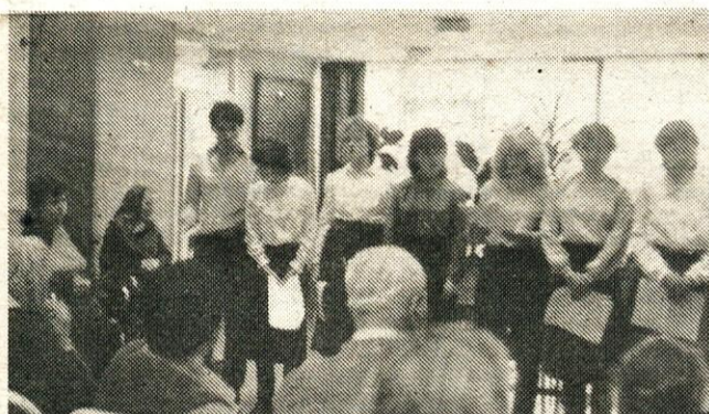
Na sliki: Mladi kulturniki OO ZSMS Doma upokojencev so s svojim skrbno pripravljanim recitalom upravičili svoj prvi nastop na proslavi ob 8. marcu.

Naj še omenimo našo novogradnjo, naše prizidke, ki rastejo iz dneva v dan. Že dolgo je pri nas veliko delovišče. Ne manjka hrupa in šumov, a upamo, da bo tega vedno manj, saj se že vidijo obrisi novih stavb, in predvidoma bo do avgusta že vseljivih nekaj sob. Delo pa bo seveda še trajalo. Ko bomo spet prestavili ure, bo čas bolj zgoden, mi pa »pohitimo« za njim, da bo pomlad čimprej prinesla več sonca, ki si ga že tako želimo.