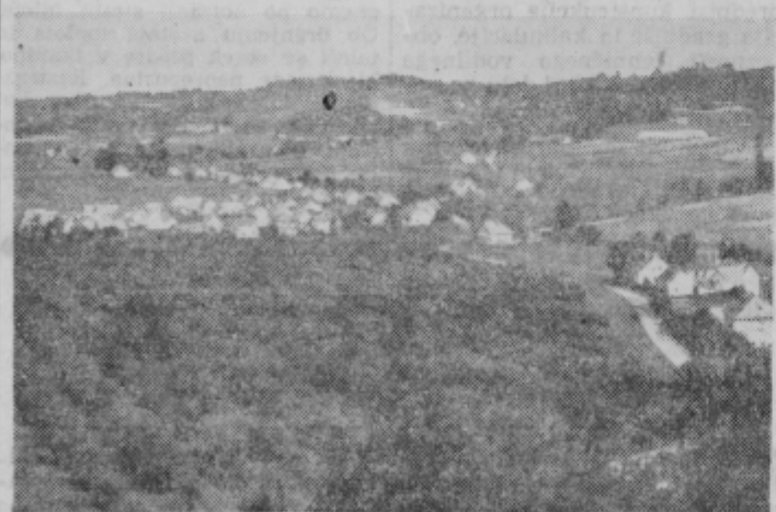
Severni del panorame v Ptujju in naselje bratov Rešev v Stukih