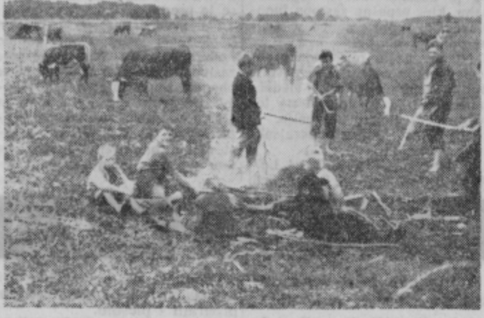
Medtem ko se pase živina po izdatni paši, si pastirji in njihovi spremljevalci zakurijo in pečejo krompir ali koruzo

krompirja, ki smo ga morali mlajši speči starejšim (li) in s tem zaslužiti privilegij biti v njihovi družbi. Nekoč smo pekli tudi čebulo in zelje ter jedli s pečenim krompirjem s soljo. To so bile pastirske poslastice. Če mi je gospodinja dala s seboj gibanice, ki so bile pri hiši skoraj na dnevnem redu, sem jih moral na travniku skriti nekam v grmovje ali na drevo, da jih niso opazili ostali pastirji, sicer bi mi jih pojedli. Nekoč smo se delili v dve vrsti: v pastirje in pastirčke. Prvi so bili starejši, ki so hodili v zadnje razrede osnovne šole ali pa so že končali šolo. Pastirčki pa so bili mlajši, tam do petega razreda.