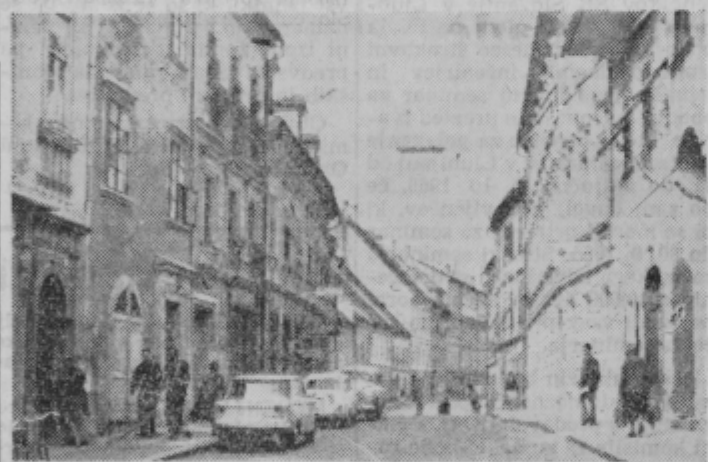
Prešernova ulica v Ptujju — dom JLA z desne strani; s svojo obnovljeno fasado ta del ulice zelo poživí in je ulica tudi svetlejša