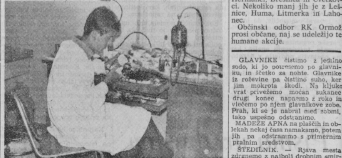
IZDELAVA UMETNEGA ZOBOVJA JE ZAHTEVNO DELO

Zdravstveni dom v Ormožu je pred leti dobil nove poslovne prostore v novo zgrajenem zdravstvenem paviljonu v Ormožu. V novi zgradbi so ordinacije splošne prakse, laboratorij, previjalnice in drugo; staro zgradbo zdravstvenega doma pa so namenili za potrebe zobozdravstva. V njej so zaposleni tri zobozdravniki in nekaj zobotehnikov, ki izdelujejo umetno zobovje. Na sliki zobotehnik na svojem delovnem mestu. Zobozdravstvena služba je na območju občine Ormož dobro organizirana, saj so zobozdravstvene ambulante v Središču, pri Miklavžu in v Podgorcih.