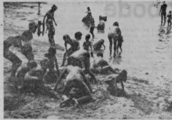
Odrasli se kratkočasijo na ležiščih, otroci pa v pesku in pozabijo, da bi se lahko osvežili v udobno topli morski vodi