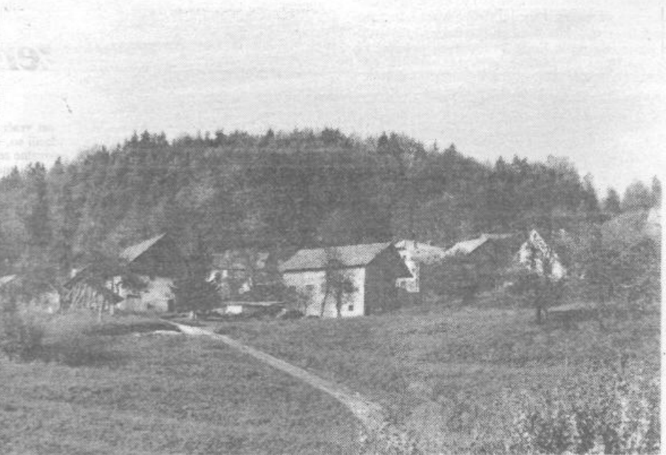
Babnogorska panorama: z asfaltom bodo prišli tudi izletniki

Nuša Gašper, 5. a OŠ Primoža Trubarja V. Lašče