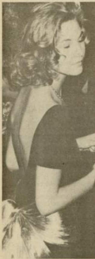
Le sanjaj, marjetica. In o čem sanjaš?

Dolga procesija, mimohod maturantov, ki jih je publika