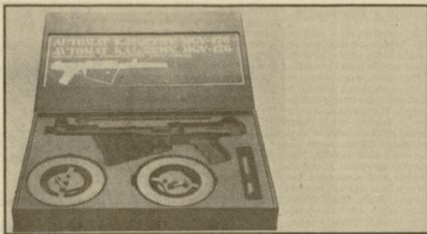
Avtomatska puška MGV 176 je naprodaj skupaj s priborom za čiščenje, dušilcem in dvema magazinoma.

Faksimile dela prospekta za MGV 176, ki našteva prednosti orožja v angleščini.