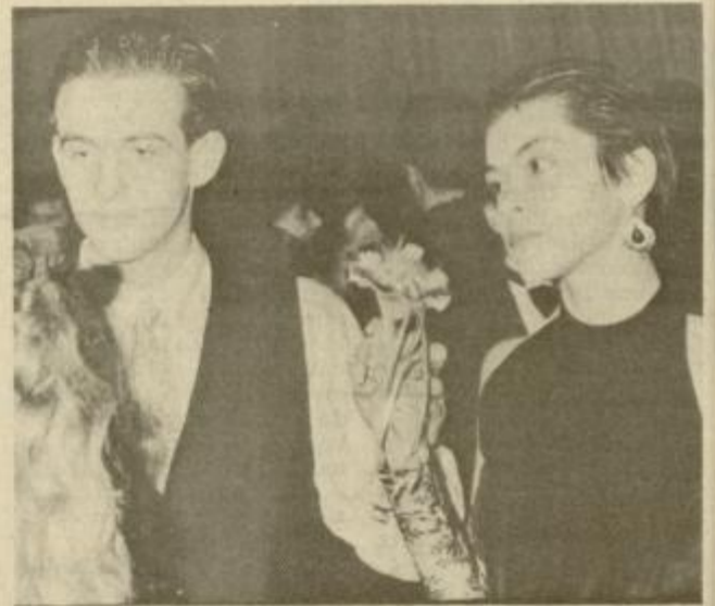
Cvetlični šopek za vsako rožo.

Mlada leta, veja polna cveta, v soncu guga veter jo od juga... (O. Župančič)