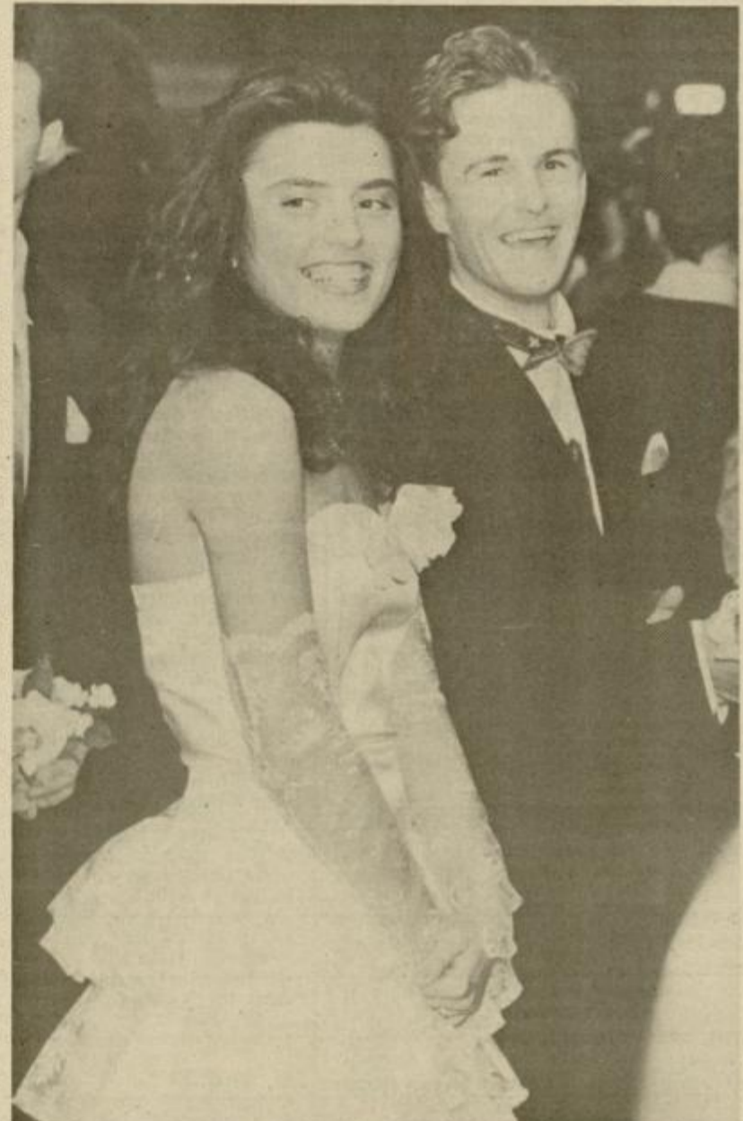
Par za eno noč ali par za vekomaj?