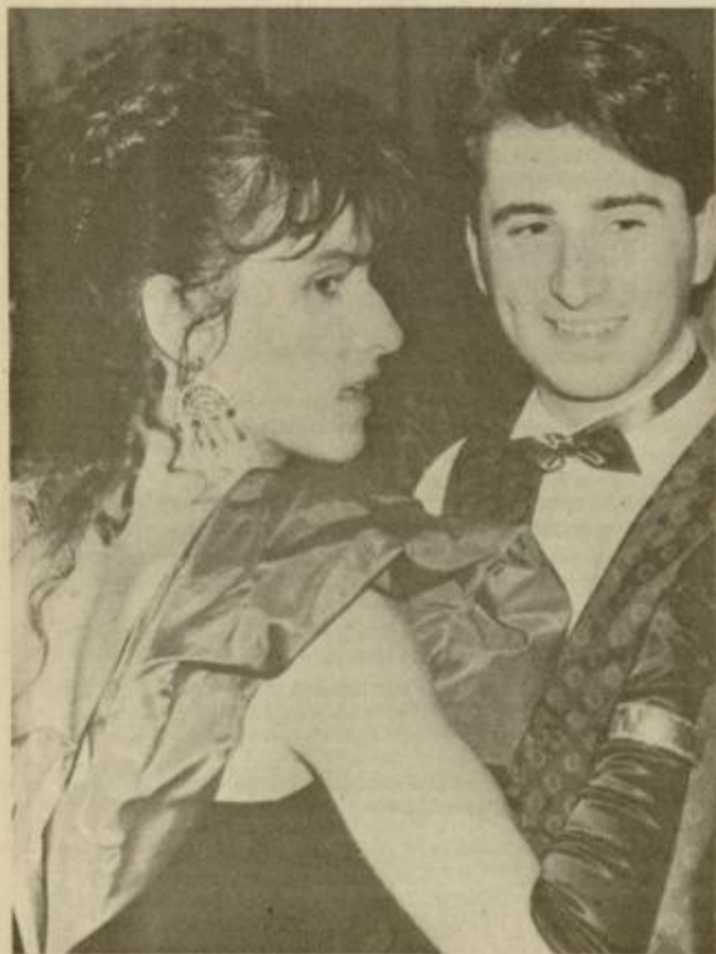
Orhideja in metuljček, barvno uigrana.