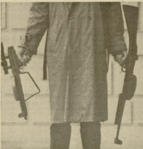
Primerjava MGV 176 z eno izmed avtomatskih pušk podobnega namena pove že na prvi pogled vse.

seveda naj- jihovi izdel- ke, pa seveda v minulih ih pa so Go- zdelek, ki je kaj posebne- armatsko pu- arno oznako achine Gun ki ni le si- sebež med izdelki, tem- šna revolu- odnim orož- ega namena tržišču.