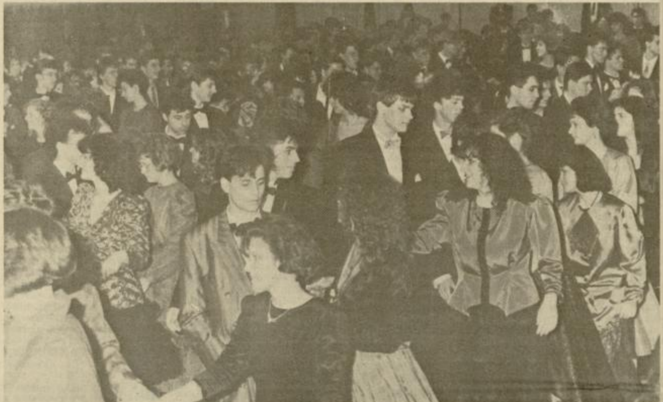
Tedni in tedni truda, da bi bila četvorka najlepša. Starejši, ki hočejo biti vedno in povsod zraven, vse pokvariijo. Za četvorko je potrebno veliko prostora.

Tudi to je bil sestavni del rituala. Nekaj nerodnosti pri