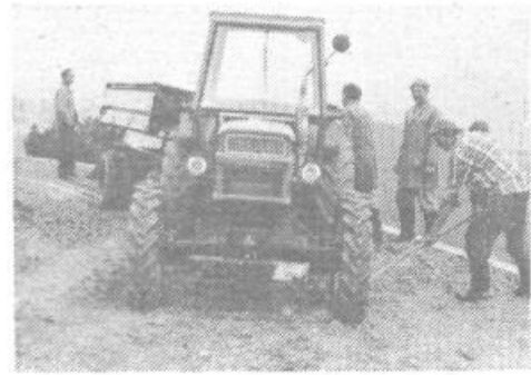
Med problemi, s katerimi se otepa Korena nad Horjulom, je bilo vse do nedavna tudi neurejeno vprašanje

Dokončana je tudi druga faza izgradnje telefonskega omrežja, s čimer je dobil kraj 80 novih telefonskih števil. Finančna sredstva so prispevali predvsem krajinasi sami.