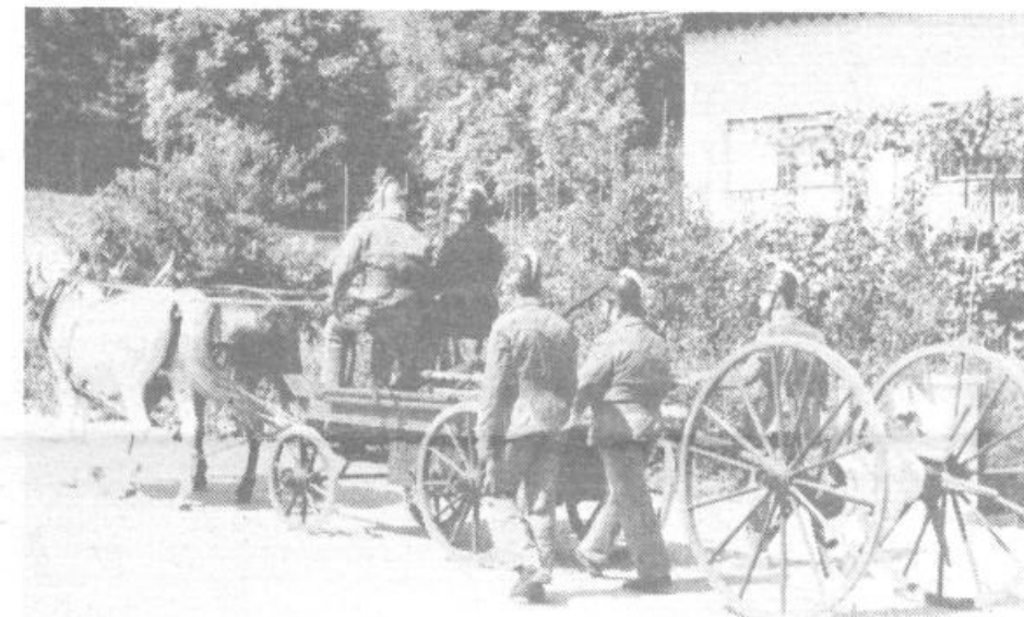
Na paradi so prikazali tudi staro gasilsko opremo