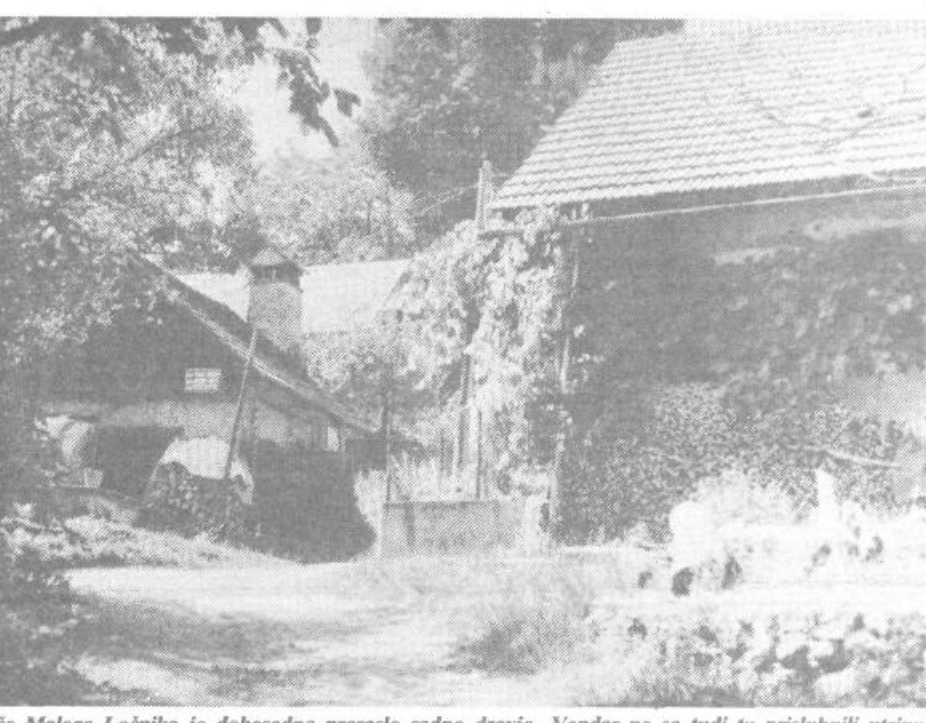
Hise Malega Ločnika je dobesedno preraslo sadno drevje. Vendar pa so tudi tu prisluhnili utrupu modernega časa.

1948) natanko 82 prebivalcev. Vendar pa kraj kljub temu ostaja med revnejšimi. Le štirje kmetje menja premorejo nekaj nad 10 hektarov zemlje, pa še to z gozdom vred. A so